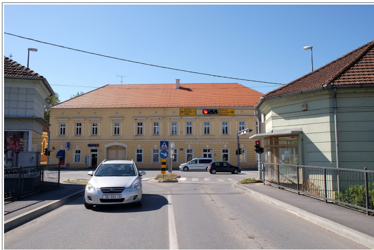
Pogled prema Hotelu Pakrac i Trgu dr. Ivana Šretera