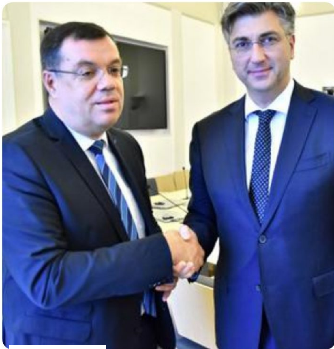
DOSSIER BOLNICA II.