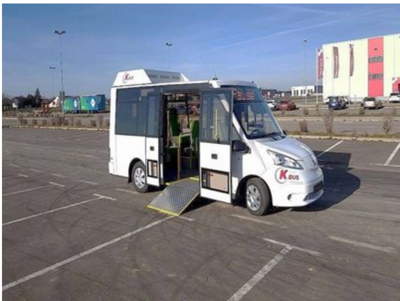
Porečki električni mini bus (ilustracija) 18.11.2020. (09:14)