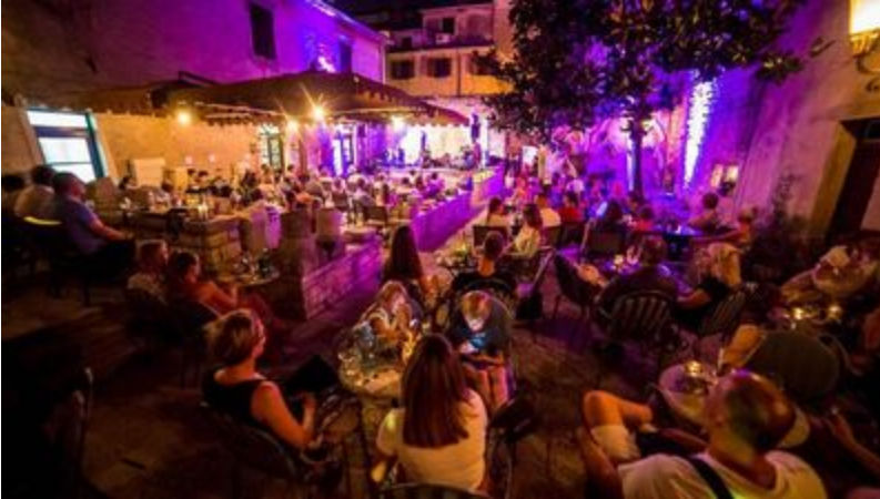
Jazz u Lapu