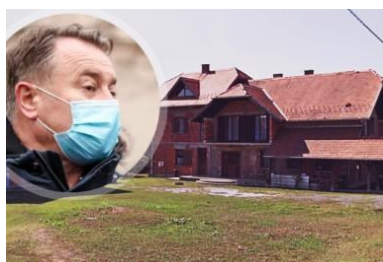
Ovo je Žinićeva kuća koju