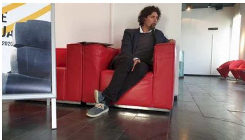
Belas: Odlučili smo nastaviti kao da nam je svaki događaj posljednji i to se pokazalo dobitnim