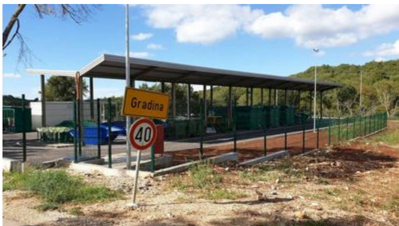
Reciklažno dvorište u Gradini pred otvaranjem

Nažalost, svjedoci smo svakodnevnog nemara i nebrige pojedinaca koji svoj otpad odlažu u okoliš, ne mareći za posljedice. Na to ukazuje i činjenica da je ovog proljeća Općina provela akciju otkrivanja i saniranja divljih odlagališta, u kojoj je detektirano čak 18 divljih odlagališta koje je Općina zatim i sanirala putem svog komunalnog poduzeća Montraker d.o.o. Otvaranjem i stavljanjem u funkciju reciklažnog dvorišta doprinijet ćemo smanjenju odlaganja problematičnog otpada, manjih količina glomaznog otpada i drugih korisnih sastavnica komunalnog otpada u spremnike za miješani komunalni otpad,. Sve će to rezultirati smanjenjem smeća i opasnog otpada u okolišu, čime će se povećati kvaliteta života i zdravlja stanovništva te podići svijest građanstva o nužnosti i potrebi očuvanja prirode i zdravlja okoliša, zaključio je Gerometta. (Napisala: Kristina Flegar)