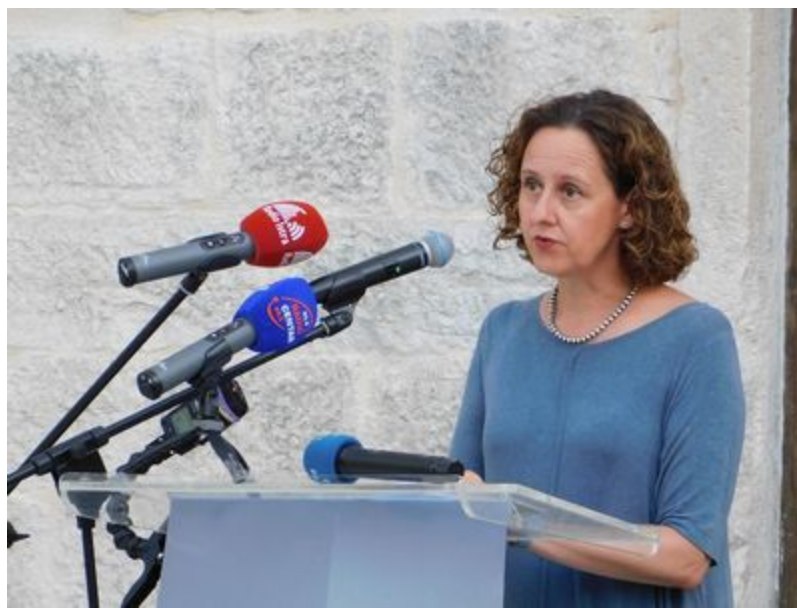
Ministrica kulture i medija Nina Obuljen Koržinek

Osim cjelovitih građevinskih radova koji uključuju sanaciju konstrukcije i novu gromobransku instalaciju, koje je izvela specijalizirana tvrtka Kapitel iz Žminja, podizanjem skele u cijeloj visini zvonika omogućena su dodatna konzervatorsko-restauratorska istraživanja kojima su dopunjene i zaokružene spoznaje o njegovoj genezi. Radovi su, prema okvirnom sporazumu, vrijedni 2,4 milijuna kuna (uključujući PDV) i bilo ih je moguće dovršiti u tako kratkom roku zahvaljujući novom modelu financiranja. Sredstva je kroz programsku djelatnost Hrvatskog restauratorskog zavoda osiguralo Ministarstvo kulture i medija RH, dok je dovršetak radova u zacrtanom roku omogućen sufinanciranjem Porečke i pulske biskupije te Istarske županije, uz potporu Grada Poreča.