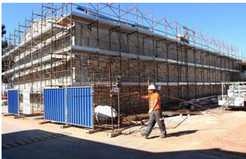
Radovi na rekonstrukciji stare kino dvorane

U Novigradu, na Porporeli, u tijeku je opsežna rekonstrukcija stare kino dvorane, u zgradi podignutoj još 50-tih godina prošlog stoljeća. Kino dvorana puna dragih uspomena, od školskih priredbi, svečanih sjednica i obilježavanja važnih godišnjica do plesova, filmskih projekcija, predstava i koncerata, uskoro će postati suvremeni multimedijalni kulturno – društveni centar.