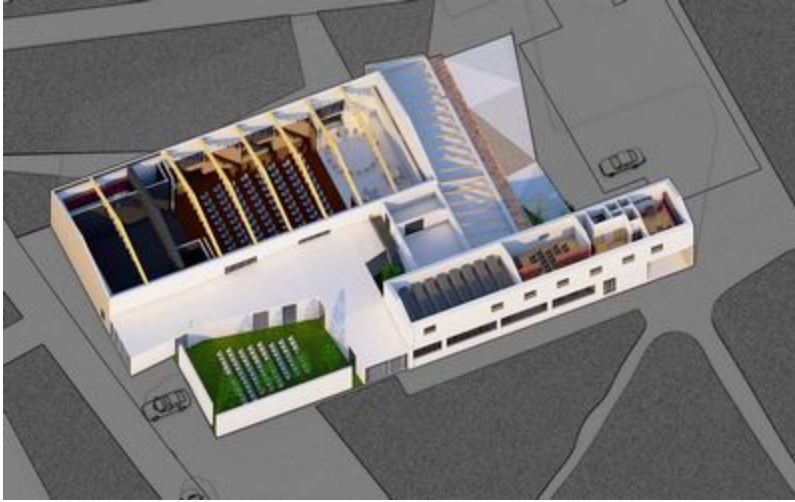
Ilustracija interijera zgrada

Kino dvorana je smještena u monumentalnoj građevini iz 50-ih godina, u kojoj se nalazilo najprije Narodno sveučilište, a kasnije Otvoreno, odnosno Pučko otvoreno učilište. Prije 12 godine dio zgrade je temeljito obnovljen za potrebe Gradske knjižnice koja je ovdje unijela novi život i odlično funkcionira. Prostor kino dvorane tada nije obnavljan. Tek je u nekoliko navrata djelomično saniran, što je omogućilo nastavak njegovog korištenja, iako u smanjenom opsegu. Aktualnom rekonstrukcijom, Novigradani će dobiti višenamjenski prostor u kojemu je, uz projekciju filmova, moguće ostvarivati različite programe i sadržaje, čak i istovremeno. Prostor će, naime, biti podijeljen u tri dijela koja će biti moguće koristiti svaki zasebno ili pak spojene u jednu cjelinu za veće manifestacije.