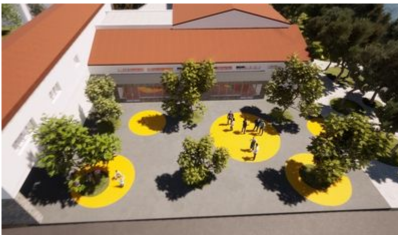
Ilustracija zgrada s okolišem iz zraka

Turatovim projektom će sadašnja pozornica biti pretvorena u takozvani kazališni black box - prostor koji može funkcionirati samostalno, kao mjesto za održavanje komornijih programa za uži krug publike, poput manjih kazališnih predstava, glazbenih događanja i slično. Drugi, najprostraniji dio, bit će namijenjen publici kao fiksno gledalište, amfiteatar za, primjerice, predavanja i prezentacije. Treći dio, smješten u dnu dvorane, zamišljen je kao prostor najšire primjene, koji može ugostiti najrazličitiji sadržaji. U njemu neće biti fiksnih stolica, ali će u trenu, kad to bude potrebno, postajati produžetak gledališta.