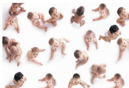
Na današnji dan 1998. zabranjeno je kloniranje...