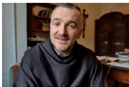
[VIDEO] Radosti i žalosti jednog svetca

Još iz rubrike: Istinito, lijepo i dobro