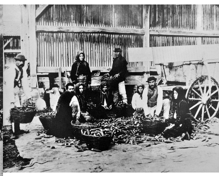
fotografije motiva iz Kopačkoga rita