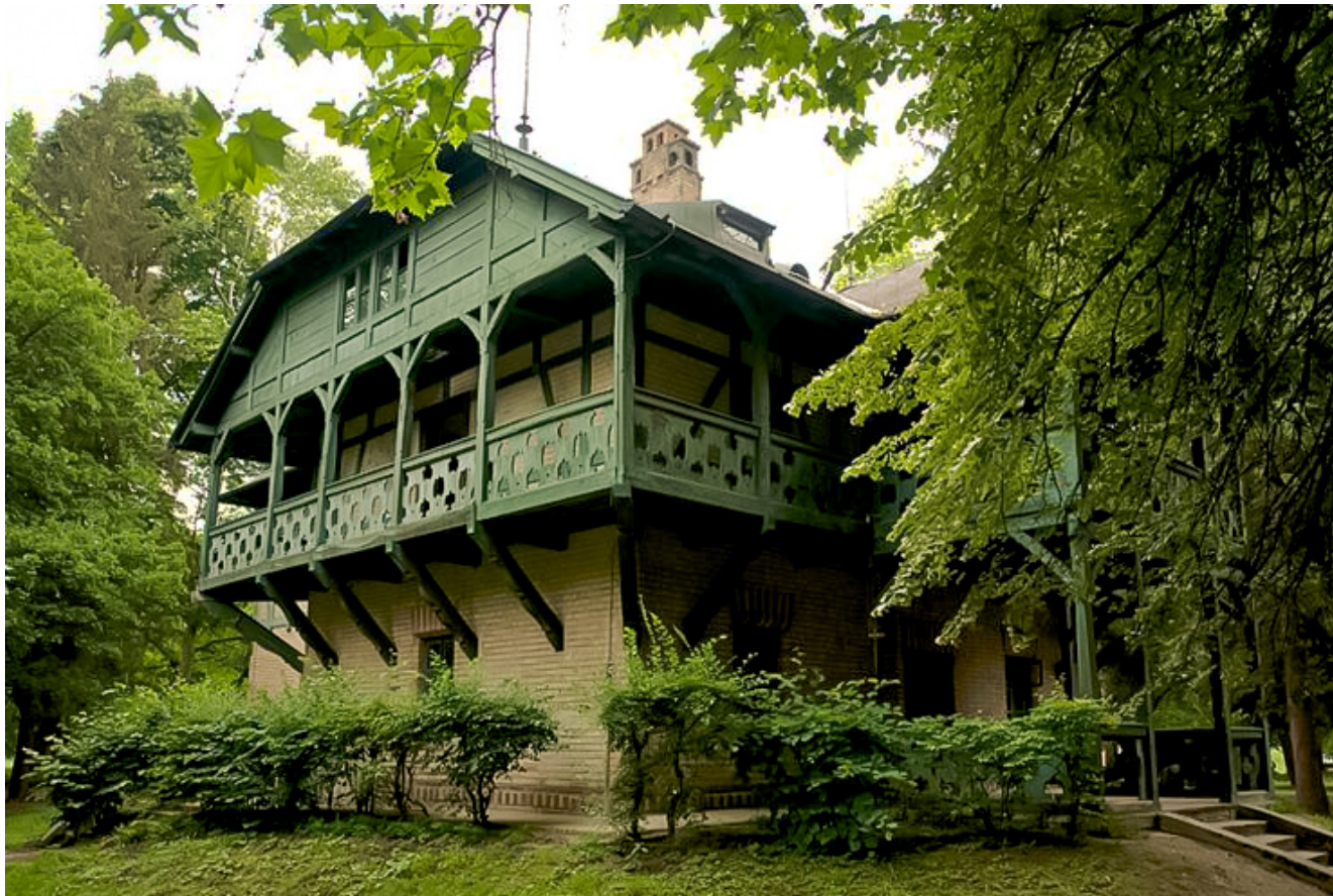
Foto: Stari dvorac koji je služio kao lovačka kuća

U blizini je sagrađena i tzv. vojarna, gdje su boravile ekipe osiguranja, najvjerojatnije je sagrađena početkom 20. stoljeća. Od starijih građevina tu je još kapelica i lugarnica- prizemna kurija.