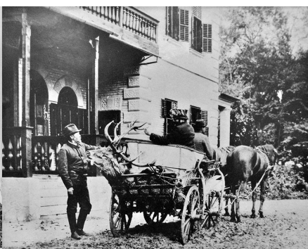
fotografije motiva iz Kopačkoga rita