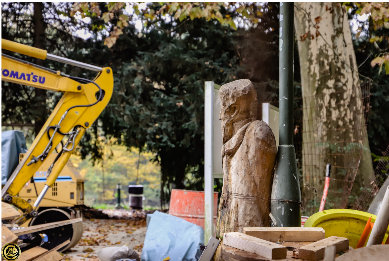
Foto: Tikveš, radovi u tijeku, listopad 2020. godine/Blaga&misterije

Zapušten i devastiran nakon Domovinskog rata, Tikveš je godinama stajao kao podsjetnik na prohujala vremena. Cijelo to vrijeme javnost dvorce nije mogla posjetiti niti uživati u njima. Danas se nalaze pod upravom Parka prirode Kopački rit i dio su projekta vrijednog 61 milijuna kuna kojim će se cijeli kompleks dvoraca Tikveš obnoviti i prenamijeniti u Prezentacijsko-edukacijski centar koji će interpretirati prirodnu baštinu Kopačkog rita.