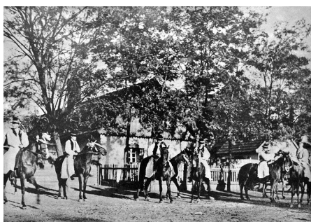
fotografije motiva iz Kopačkoga rita