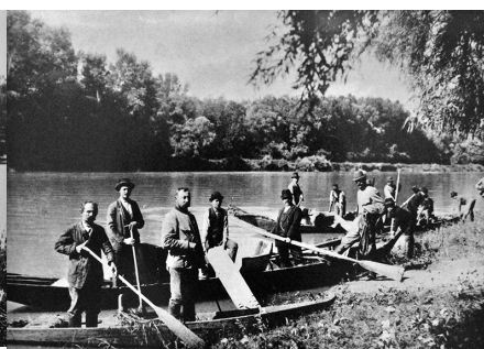
fotografije motiva iz Kopačkoga rita

Dvorac je prilično stradao krajem rata 1918. godine, ali je ubrzo obnovljen, a sagrađen je i novi dvorac u klasicističkom stilu, danas glavni centralni rezidencijalni