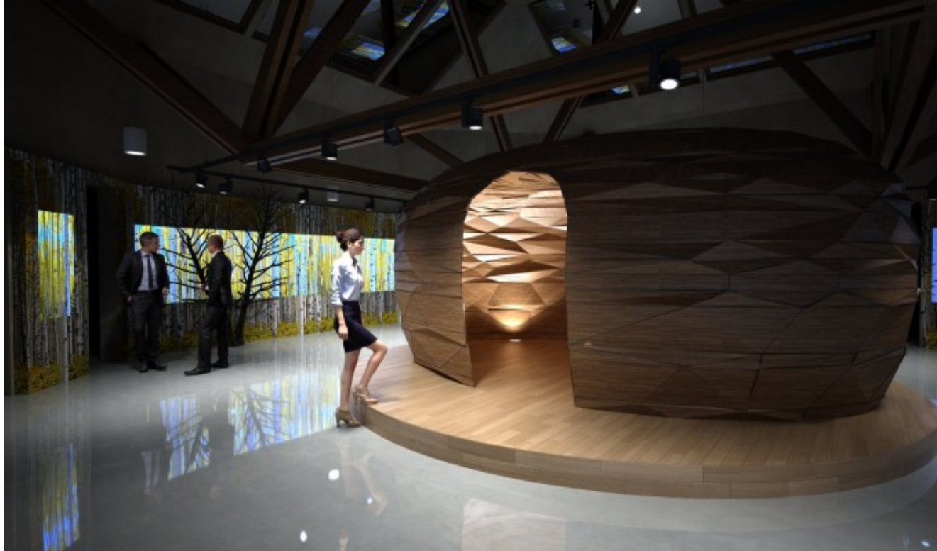
Foto: Prezentacijsko edukacijski centar Tikveš, prikaz/SAFU, središnja agencija za financiranje i ugovaranje

Ukupna vrijednost projekta iznosi 61.066.740,42 kuna, od čega je 85% financirano iz Fondova Europske unije, a 15% su Javna sredstva – Fond za zaštitu okoliša i energetske učinkovitost te Ministarstvo zaštite okoliša i energetike.