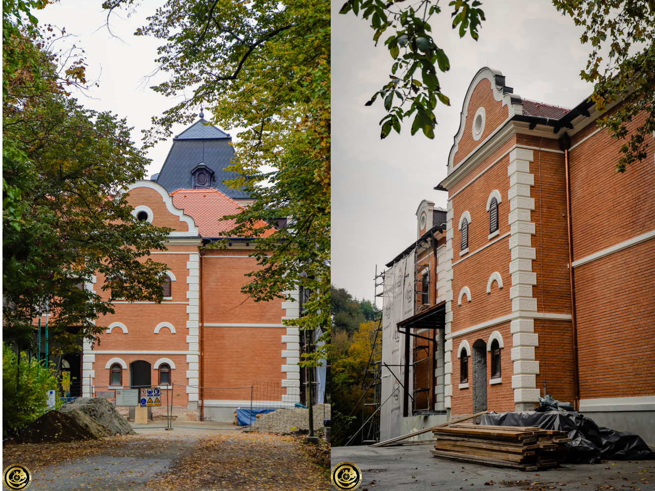
Foto: Novi dvorac Tikveš listopad 2020. godine/Blaga&misterije