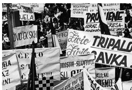
Na današnji dan započela uhićenja...

Još iz rubrike: Istinito, lijepo i dobro