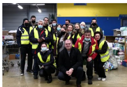
Karlovački volonteri pomažu unesrećenim...