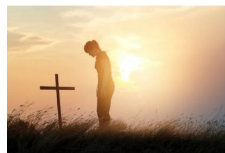
Podaj nam milost da se sve u nama pokloni Tebi