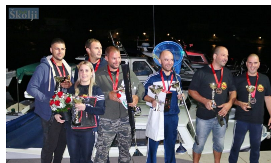
Lukoran: 4. Crnilo kup 2020.