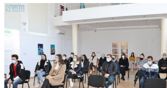
Preko: Potpisani ugovori za studentske stipendije