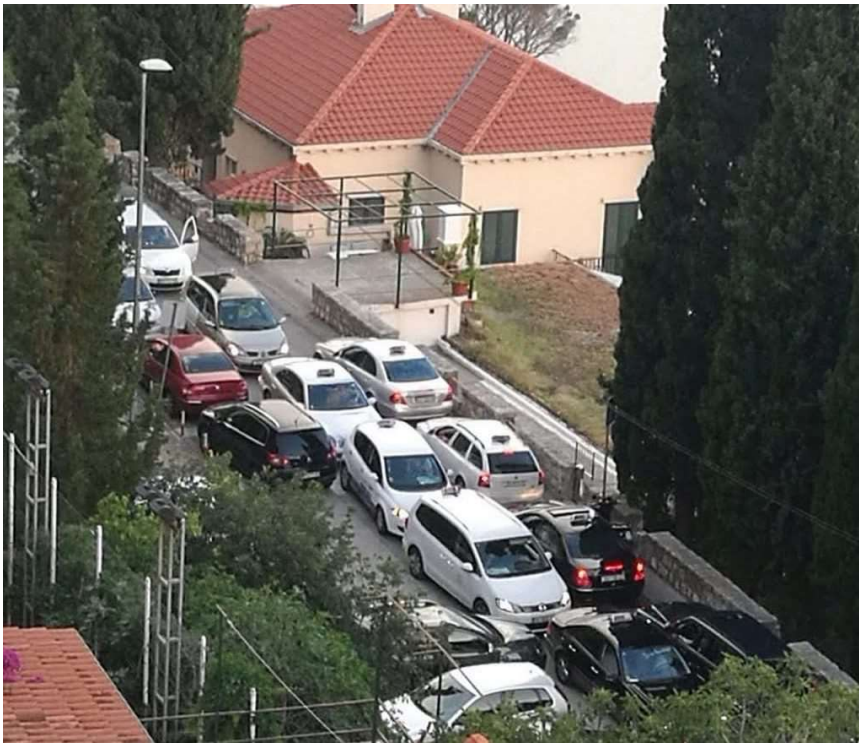
Ovako je lani izgledala Ulica Frana Supila

Pločnik, namijenjen pješacima od izlaska iz naselja kroz Ulicu Frana Supila, postao je nedostupan pješacima, pa smo prvo raslinje, koje je u više navrata padalo po trotoaru, uz pomoć Grada (JVP Dubrovački vatrogasci, Čistoća, Vrtlar i Tehnogradnja) uklonili i nakon 30-ak godina očistili. Akciji su se pridružili i brojni stanovnici naselja, kažu.