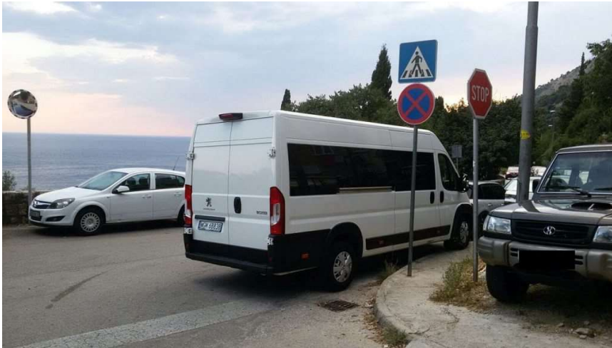
Zakrčena Ulica Frana Supila

-Nedostatak parkinga određuje sve drugo u prostoru Zlatnog potoka, a činjenica je kako su lani brojna taxi i rent-a car vozila potpuno zagušila Ulicu Frana Supila od Viktorije do Belvederea.