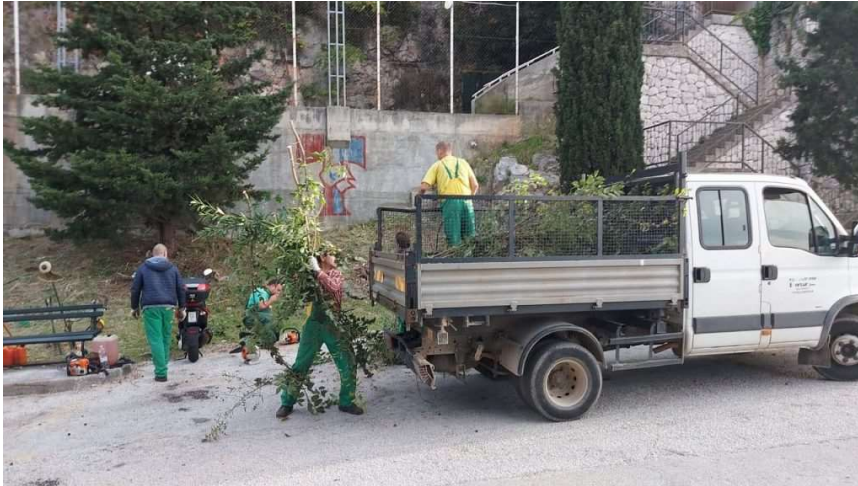
Akcija čišćenja okoliša u listopadu 2020.