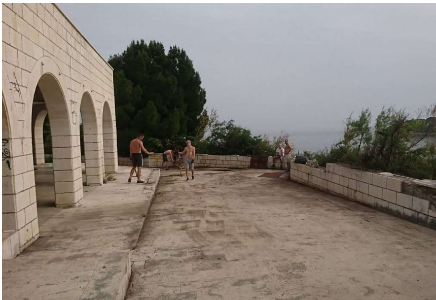
Ekipa čisti Ulicu Vlaha Bukovca ispred devastiranog Hotela

Sve je počelo s javnim kupalištem na Belvedereu, gdje se dio stanovnika Zlatnog potoka kupa. Sami su se organizirali i uredili betonsku plažu kraj hotela, koji oronuo 29 godina čeka obnovu.