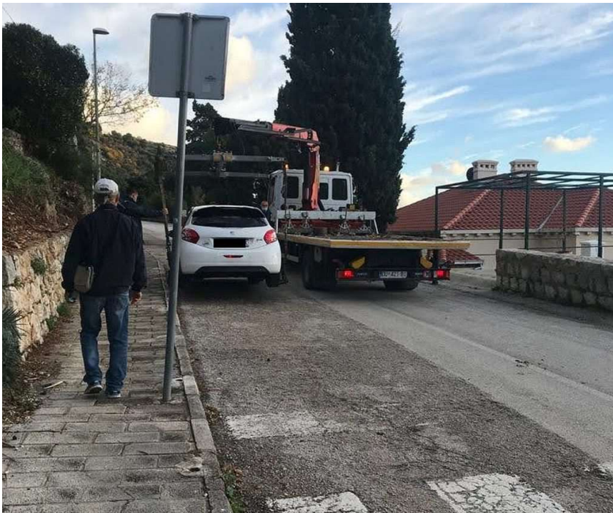
Ulica Frana Supila sad

-Pješačka staza je bila prepuna parkiranih vozila, koja su po pozivu jurila prema Pilama. To je bilo neizdržljivo. Za nas mlađe to nisu neki problemi, ali u Potoku živi puno starijih ljudi, koji su zbog svake sitnice prisiljeni ići u Grad do butige, do bolnice, apoteke. Pa onda i djeca, koja pješače do škole. Ako moraju hodati po prometnoj cesti, jer su na trotoaru parkirana auta, njihova je sigurnost ugrožena, kažu.