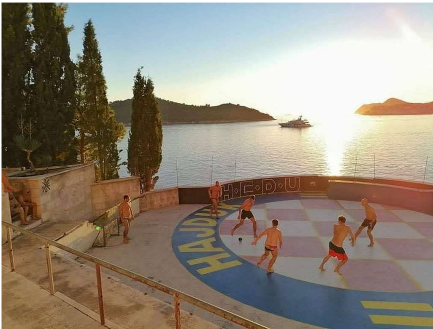
Igralište na Belvederu koje su sami građani očistili i uredili