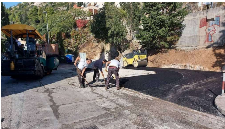
Radovi na parkiralištu ispod igrališta, gdje se planira izgradnja javne garaže

– Konačno rješenje parkinga dogodit će se kad se izgradi javna garaža ispod današnjeg igrališta. Ta bi garaža trebala imati oko 80 parkirališnih mjesta, a s njom bi se i kroz Ulicu Zlatni potok uveo novi režim parkiranja i ulica bi bila protočnija. S gradom razgovaramo o načinu kako izgraditi garažu. I vjerojatno će proći neko vrijeme, ali mi nećemo odustati. S morske strane Ulice Zlatni potok će ostati trotoar na koji se više neće parkirati, a s druge strane će se ocrtati parking koji će se naplaćivati po modelu povlaštene parkirališne karte. Širina kolnika i dalje ostaje samo jedna traka, jer drugačije nije moguće. U budućnosti mislimo kako bi Ulica postala jednosmjerna spojem na Ulicu druge Dalmatinske brigade, objašnjavaju aktivni građani.