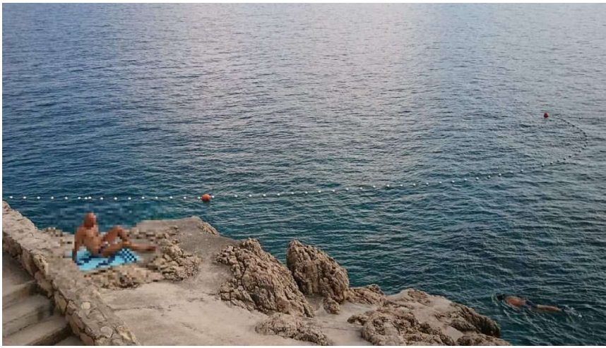
Ove godine na inzistiranje građana na Belvederu su postavljene zaštitne bove