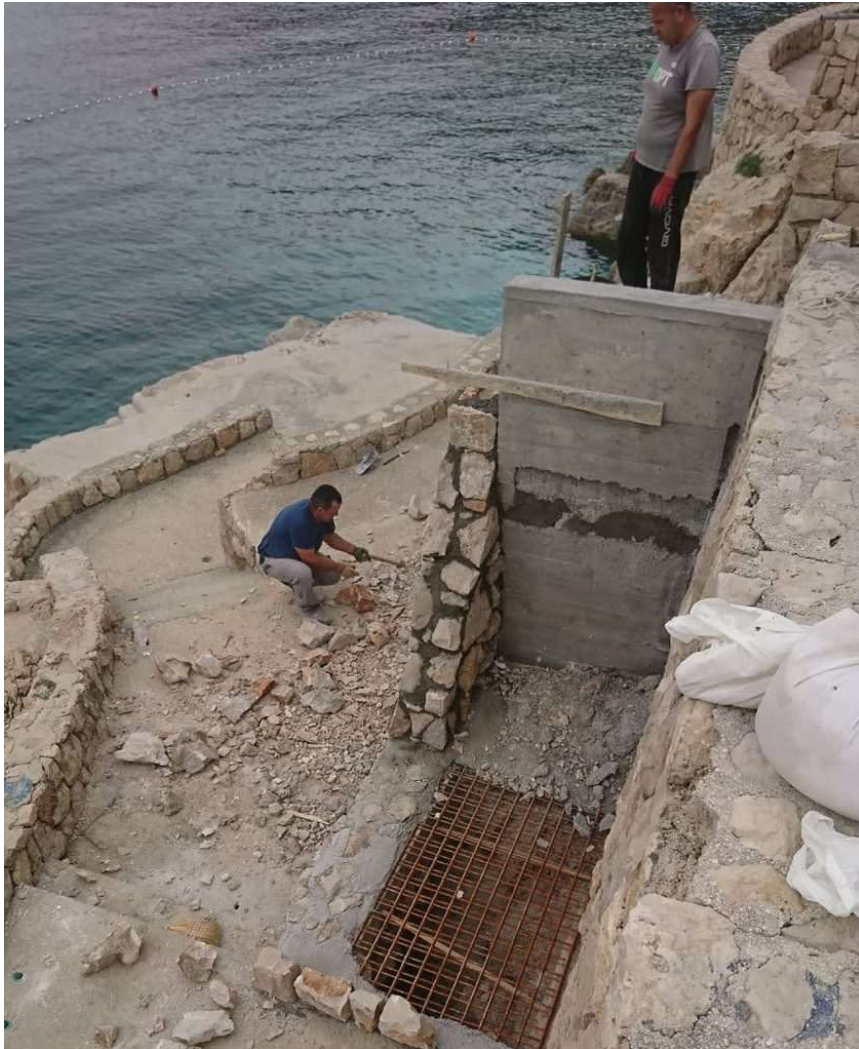
Popravlak oštećenja na javnom kupalištu Belvedere

– Gradonačelnik Franković i ova gradska uprava, kao i Srđan Obad, kotarski predstavnik imali su razumijevanja za naše prijedloge i stvari su se počele kretati nabolje. Ove smo godine s gradonačelnikom i pročelnicima imali 7 sastanaka, a Obad je nebrojeno puta išao na sastanke i dogovore, pričaju mi građani, koji rezultate svog aktivizma vide u prostoru u kojem žive i to ih potiče da aktivni budu i dalje.