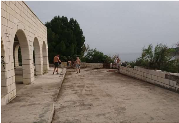
Čišćenje Ulice Vlaha Bukov

Članak je sufinanciran od strane Agencije za elektroničke medije u sklopu projekta "Javni prostor – potreba ili luksuz".