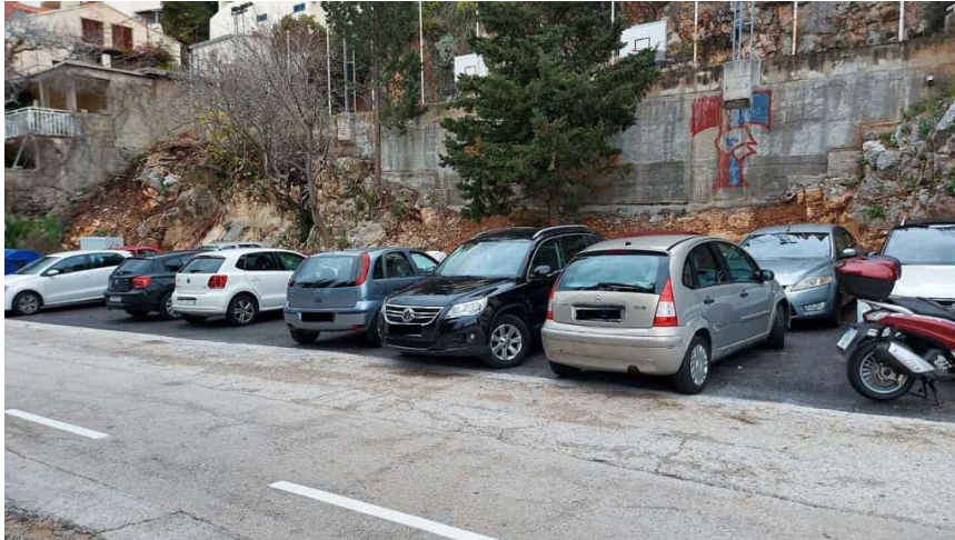
Novo parkiralište, koje je oslobodilo cestu i pješačku stazu

– Konačno rješenje parkinga dogodit će se kad se izgradi javna garaža ispod današnjeg igrališta. Ta bi garaža trebala imati oko 80 parkirališnih mjesta, a s njom bi se i kroz Ulicu Zlatni potok uveo novi režim parkiranja i ulica bi bila protočnija. S gradom razgovaramo o načinu kako izgraditi garažu. I vjerojatno će proći neko vrijeme, ali mi nećemo odustati. S morske strane Ulice Zlatni potok će ostati trotoar na koji se više neće parkirati, a s druge strane će se ocrtati parking koji će se naplaćivati po modelu povlaštene parkirališne karte. Širina kolnika i dalje ostaje samo jedna traka, jer drugačije nije moguće. U budućnosti mislimo kako bi Ulica postala jednosmjerna spojem na Ulicu druge Dalmatinske brigade, objašnjavaju aktivni građani.