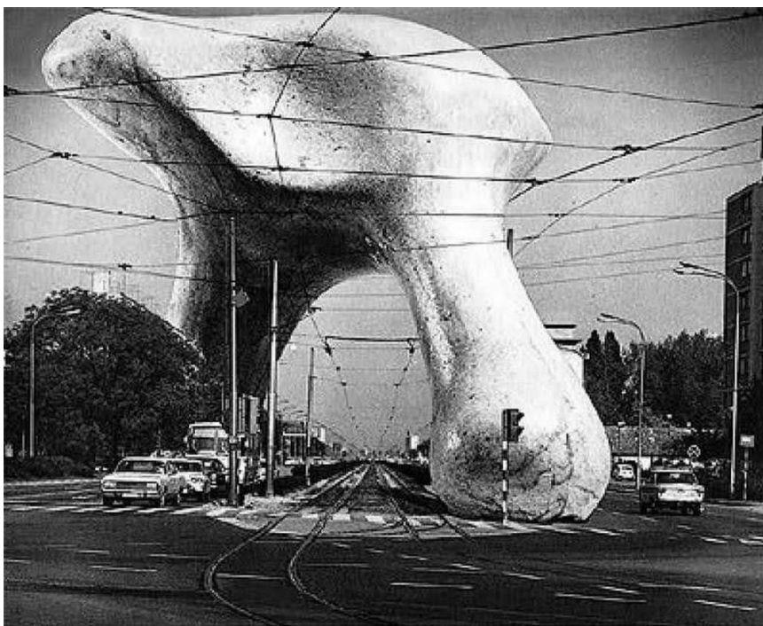
Skica skulpture Ivana Kožarića „Nazovi me kako hoćeš“

Projekt kao što je primjerice Kožarićeva skulptura organskih formi sarkastičnog naziva „Nazovi me kako hoćeš“ koja je trebala biti postavljena na sjecište najprometnijih ulica Zagreba, Savske i Vukovarske, potpuno bi izmijenila vizuru ovog presijecanja starog i novog radničkog Zagreba, i zaista je šteta da se nije i da se ne inzistira na njezinoj izgradnji.