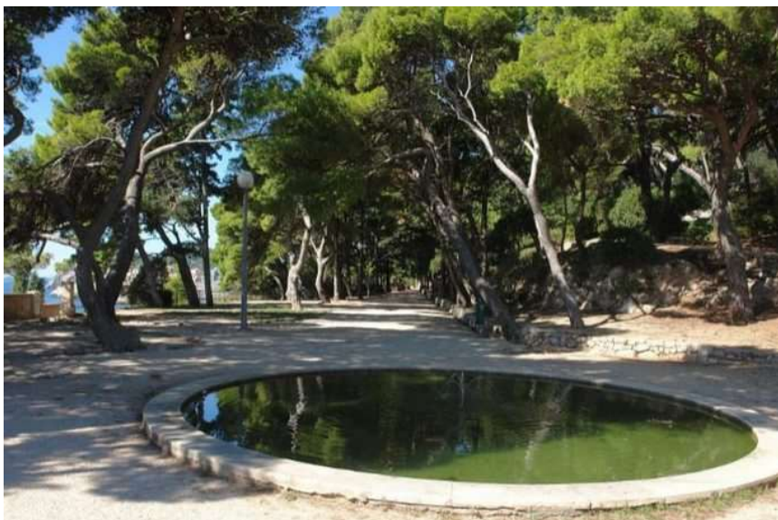
Park Gradac čeka uređenje

Brojni su javni prostori, koji bi se mogli aktivirati u tom pogledu, počevši od parka Luja Šoletića u Gružu, malog Straduna na Babinom Kuku, parka pokraj Gimnazije na Pločama, te parka Gradac, koji se sada ipak uređuje novim arhitektonskim rješenjem. Ne bih tu odmah išla u osuđivačku praksu, kojoj smo mi Dubrovčani skloni, odmah upiremo prstom u gradsku upravu.