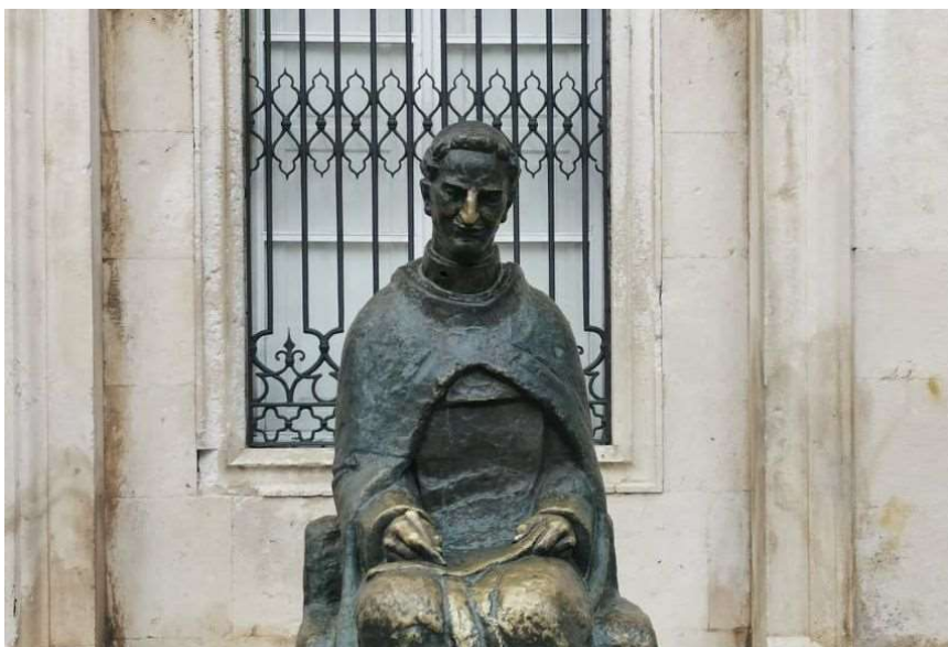
Spomenik Marinu Držiću, rad Ivana Meštrovića

-Da situacija nije crno-bijela, govori i velika crkvena narudžba vitraja za crkvu sv. Vlaha koju izrađuje Ivo Dulčić 1972. u povodu 1000. obljetnice parčeve feste. Dulčić izvanrednim talentom izrađuje cijeli ikonografski dijapazon duhovnih i svjetovnih vrijednosti Dubrovnika. I on je, kao i Meštrović, ali i brojni drugi umjetnici, bio u svoje vrijeme kritiziran, a njegov se revolucionaran rad u sakralnom slikarstvu smatrao kontroverznim. Ipak dubrovački nadbiskup Severn Pernek inzistira na odabiru i obrani Dulčića.