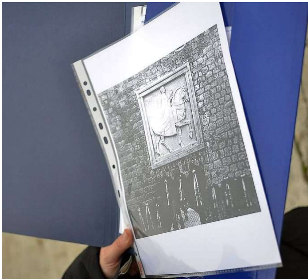
Spomenik Petru I. Karađorđeviću