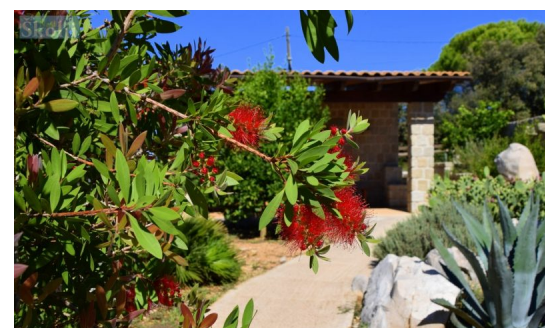
Ugljan u cvijeću 2020.