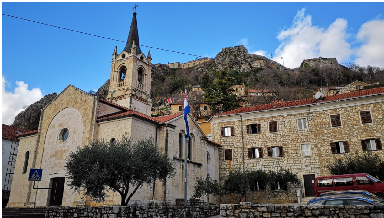
Crkva Svetog Ante

U Kninu, kaže, nema međunacionalne netrpeljivosti. Znaju se tenzije osjetiti samo na dan proslave Oluje, ali to je ne dira previše. Ona živi u svom gradu i tu se osjeća dobro.