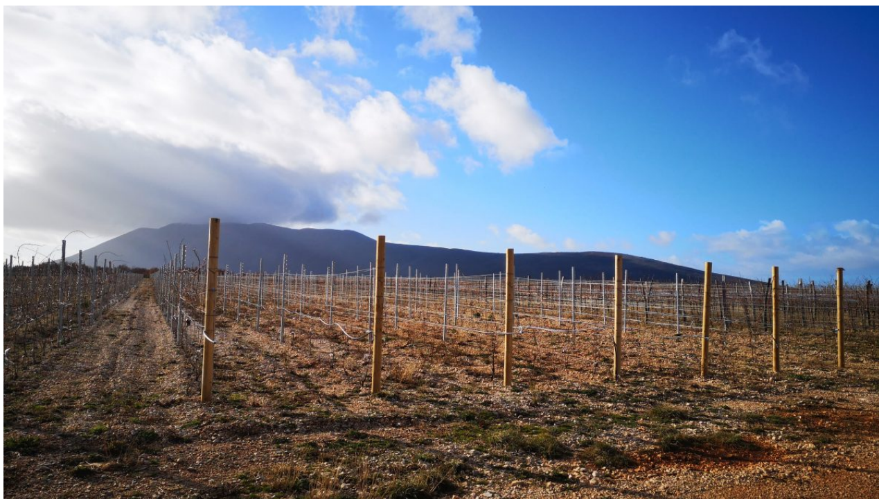
Vinogardi poljoprivredne zadruge Vrbničko selo

Anđelka nas vodi imanjem i pojašnjava nam kako se i kada što sadilo i koliko je truda i energije uloženo. Imanje je uistinu veliko i impresivno. Njoj, kao ženi, u ovom podneblju je posebno teško. „Ovo je i dalje izrazito patrijarhalan kraj. Ljudi ne vjeruju da ja kao žena mogu saditi bajame, da mogu fizički raditi i biti uspješna u vođenju zadruge i vinarije“, ističe Anđelka, ali takve reakcije je nisu demotivirale.