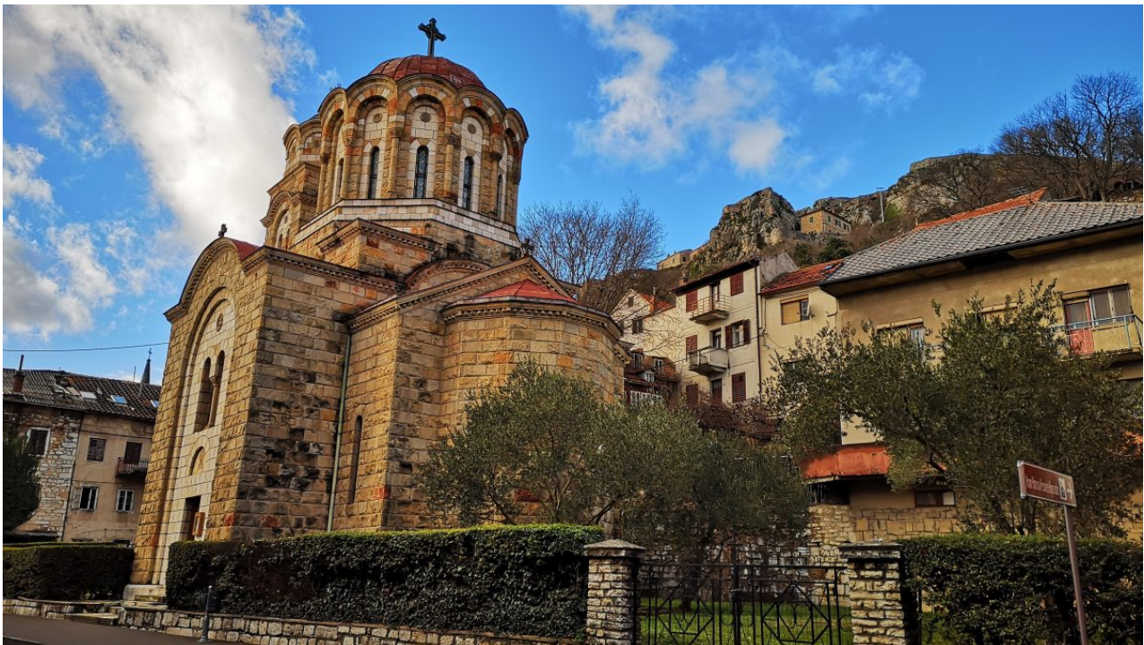
Saborni hram Pokrova Presvete Bogorodice