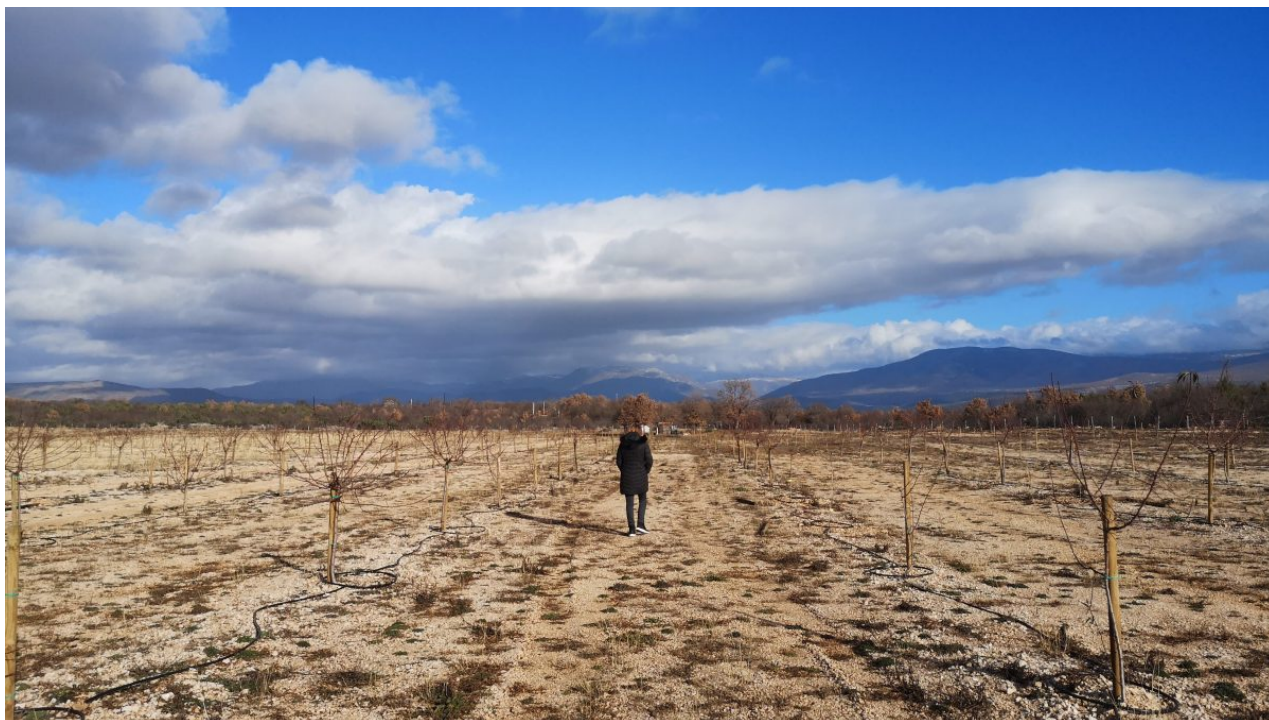
Bademi poljoprivredne zadruge Vrbničko selo

Anđelka nas vodi imanjem i pojašnjava nam kako se i kada što sadilo i koliko je truda i energije uloženo. Imanje je uistinu veliko i impresivno. Njoj, kao ženi, u ovom podneblju je posebno teško. „Ovo je i dalje izrazito patrijarhalan kraj. Ljudi ne vjeruju da ja kao žena mogu saditi bajame, da mogu fizički raditi i biti uspješna u vođenju zadruge i vinarije“, ističe Anđelka, ali takve reakcije je nisu demotivirale.