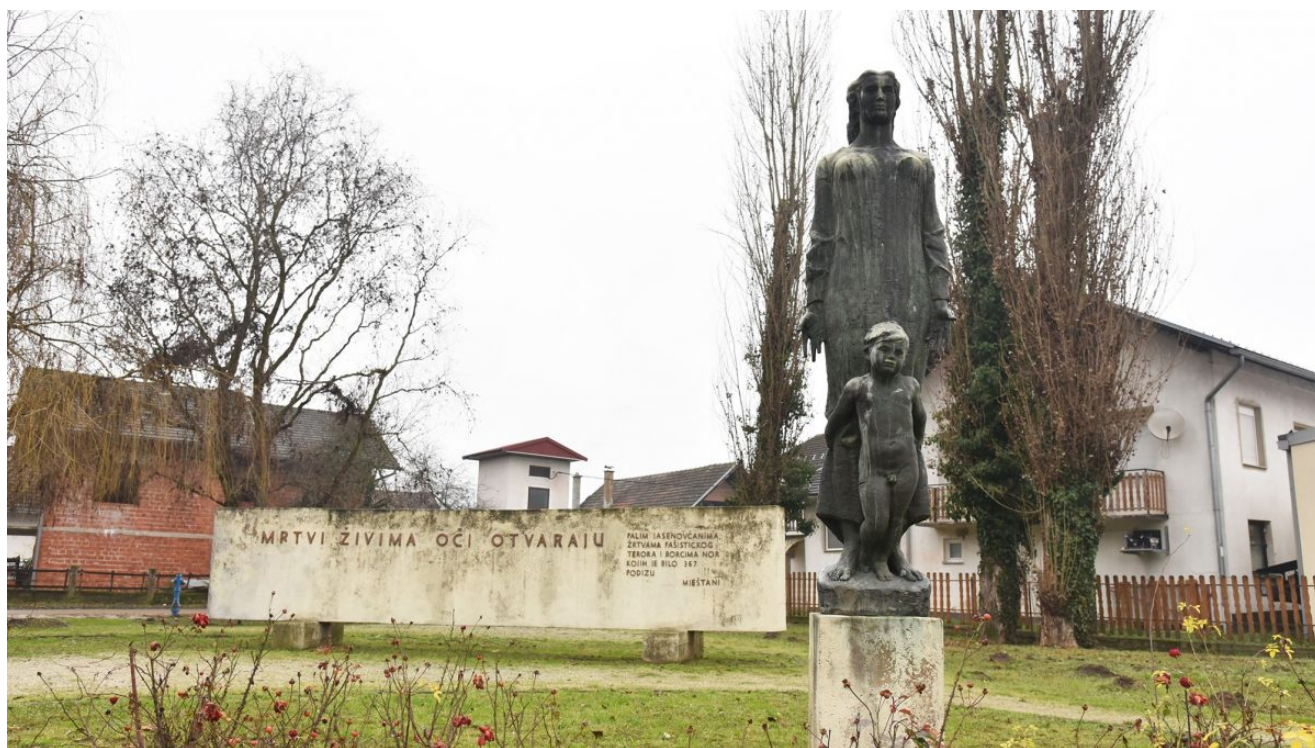
Spomenik „Mrtvi živima oči otvaraju“

Do sedamdesetih godina prošlog stoljeća mjesna škola nalazila se u centru sela, ali je u međuvremenu postala premala za potrebe mještana. Iz Spomen područja Jasenovac predložili su da im škola ustupi lokaciju u centru mjesta, a oni će zauzvrat napraviti novu školu pored Spomen područja. Tako je i bilo. U parku u centru Jasenovca, na mjestu nekadašnje škole, sada se nalazi spomenik „Mrtvi živima oči otvaraju“, autora Stanka Jančića . Spomenik se sastoji iz dva djela: skulpture majke s djetetom i velike ploče s podacima o stradanju Jasenovca.