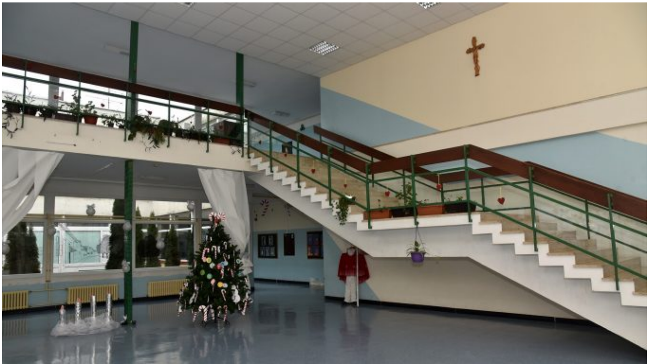
Osnovna škola Jasenovac

Pričaju nam naši sugovornici kako je prije ovog posljednjeg rata Jasenovac imao puno bolju perspektivu nego danas, ali nakon rata se malo ulagalo. „Ovo je prije rata bilo jedno prilično veselo mjesto, imali smo hotel, disko... Devedesetih je napravljena studija o izgradnji industrijske zone. Željeznički kolodvor je bio strateško mjesto, a planirana je izgradnja i jednog kolosjeka kojim bi se kolodvor povezo s riječnom lukom“, prisjećaju se naši sugovornici. Danas je Željeznički kolodvor urušen i devastiran.