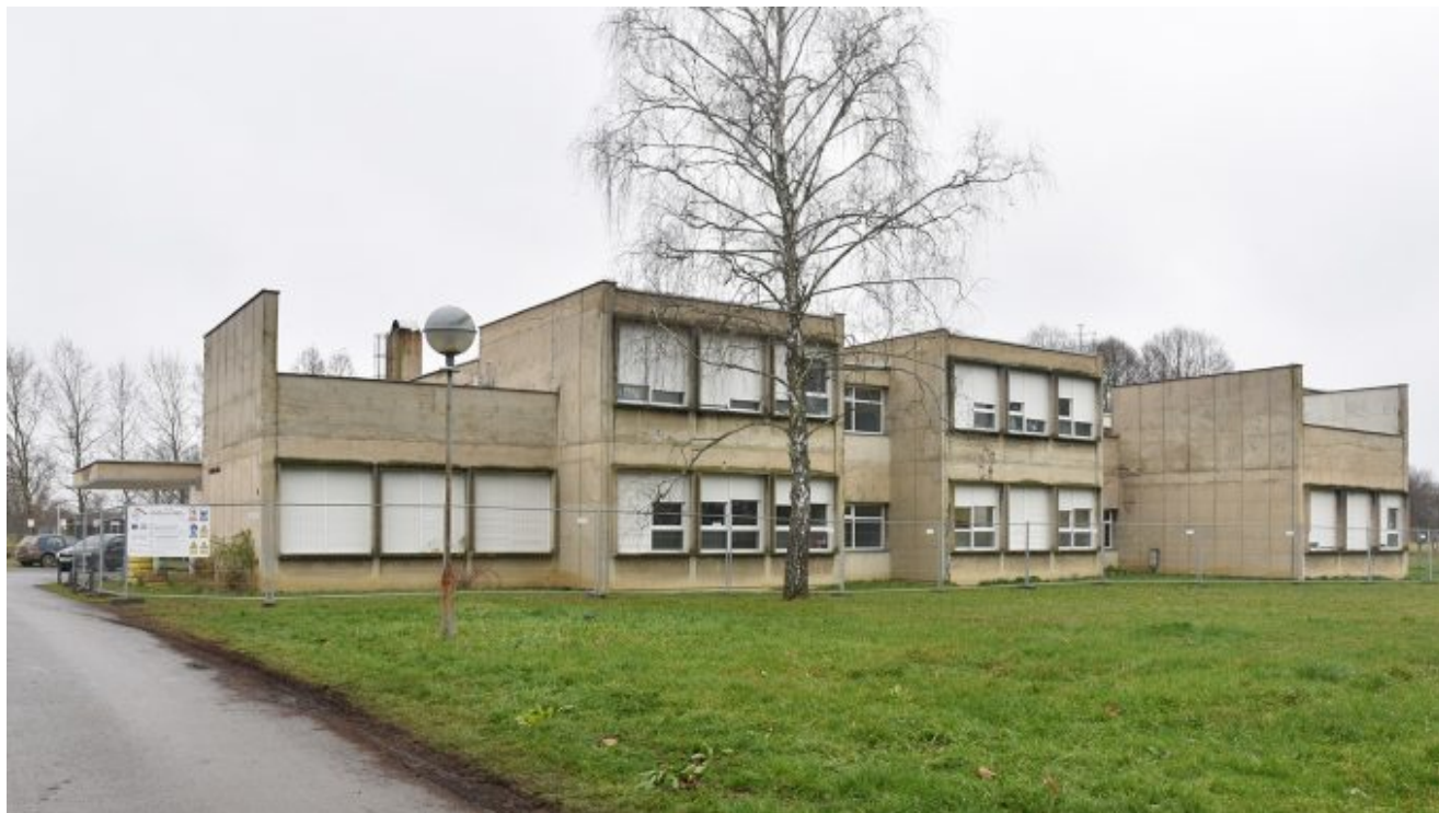
Osnovna škola Jasenovac

Osnovna škola Jasenovac još je 2006. imala 206 učenika, a danas školu pohađa njih 104. Učenici u ovu školu pristižu iz cijele Općine Jasenovac.