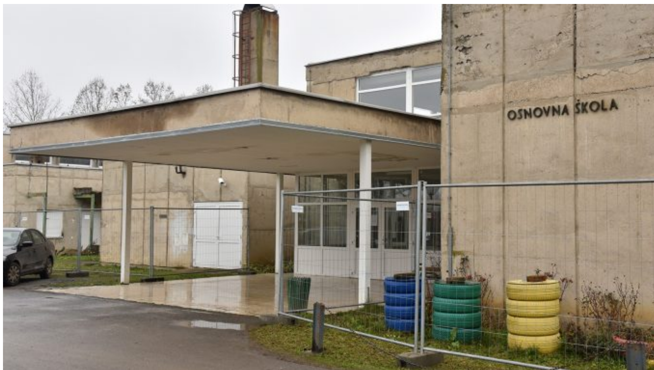
Osnovna škola Jasenovac