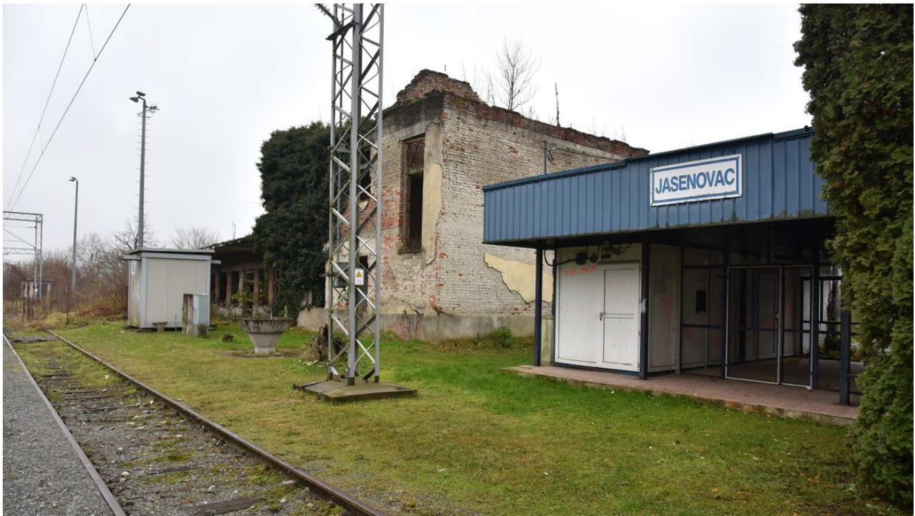
Željeznički kolodvor u Jasenovcu

Došao rat, ljudi su se iselili, neki su pustili korijenje u izgnanstvu i malo njih se vratilo. Kažu nam kako je najveći problem što nema mladih ljudi. Djeca nakon osnovne škole najčešće odlaze u Zagreb u srednju školu i više se uglavnom ne vraćaju.