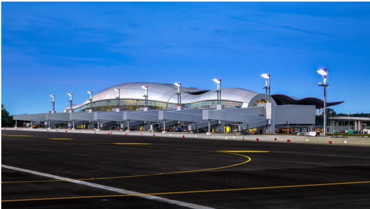
foto: Novi zagrebački aerodrom otvoren 2017. , Putnički terminal „Franjo Tuđman“

S druge strane mojih projekata idemo dalje Radio sam upravne zgrade najvažnijih korporacija, primjerice naftne kompanije INA u novom Zagrebu, pa dogradnju uprave Croatia osiguranja u Miramarskoj ulici u Zagrebu. Na kraju je tu - novi zagrebački aerodrom otvoren 2017. Putnički terminal „Franjo Tuđman“ je vrlo kompleksne arhitekture i dostojno služi percepciji onih koji dolaze u Zagreb i Hrvatsku. Ikonografski pokazujemo da smo kulturni europski narod. Prema tome, kad gledate moje djelo naći ćete ga na fokusnim dijelovima, kako kulture, tako i poslovanja i javnih reprezentativnih komunikacijskih čvorišta, s aerodromom kao reperom – to je jedan izniman opus.