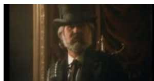
VIDEO: Umro je Kenny Rogers,