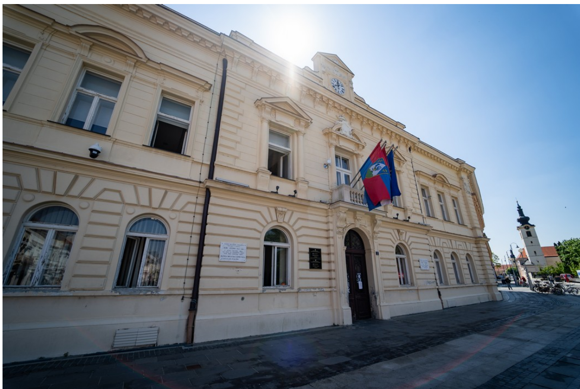
Grad Koprivnica

By Zvonimir Markač Nedjelja, 1. studenoga 2020.