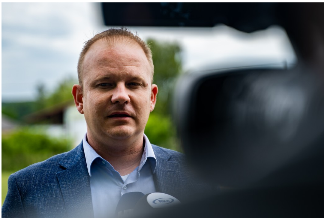
Mišel Jakšić, gradonačelnik Koprivnice