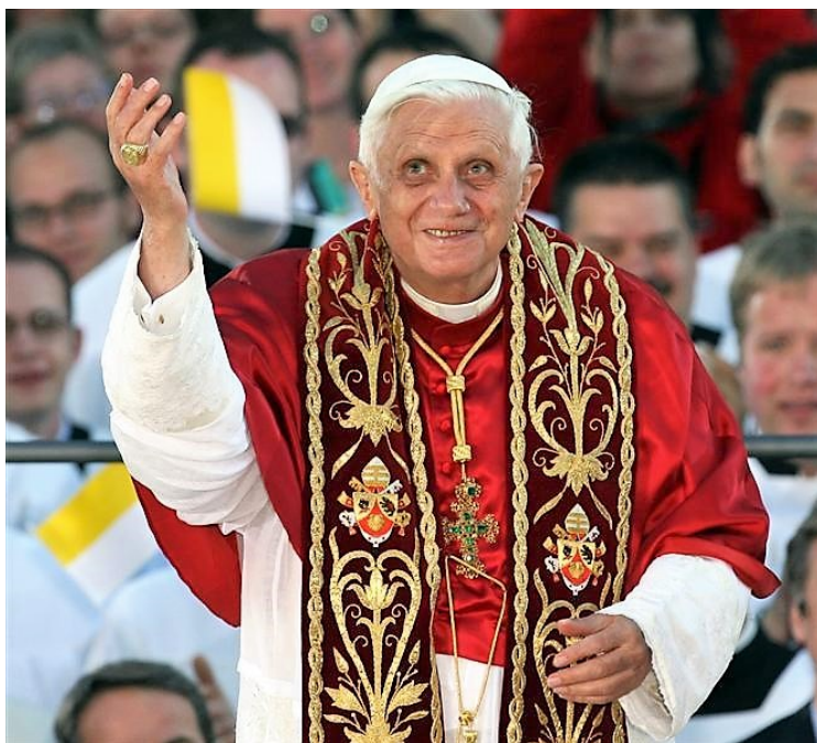
Sveti Otac Benedikt XVI.