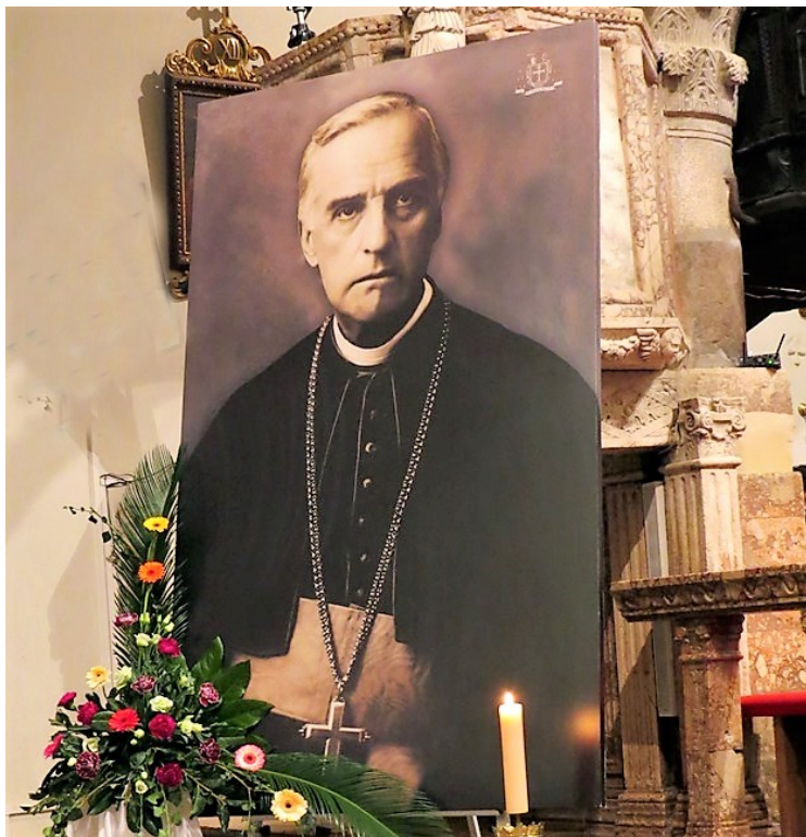
Ove godine obilježava se stota obljetnica smrti krčkog biskupa Antuna Mahnić

se istina i dobrotu ondje najviše dokažu gdje su jače ugrožene od laži i zloće. Da se Isus kretao samo među pobožnom i finom čeljadi , ne bi mogao očitovati onu silnu ljubav koja se najbolje očituje kada se i život izloži za druge; da je Stepinac živio samo u jednom dobrom i njemu naklonom okruženju, danas bi jedva tko za njega znao, a kamoli da bi se govorilo u njegovom herojskom mučeništvu za vjeru i narod. Ono što nas treba uvijek hrabriti jest da će najveći poraz laži i zloće u konačnici biti u tome što su jedna i druga – i laž i zloća – najviše pomagale pobjedi istine i dobrote, upravo onda kada su najviše protiv njih radile. Ima dosta sličnosti u osporavanju Papine i Stepinčeve svetosti, ali ima i razlike. Sličnost je u tome što su istupali protiv fašizma, nacionalsocijalizma i komunizma, ali treba dodati i liberalizma. Da je pobjeda bila na strani fašizma i nacionalsocijalizma ne bi ni Papa ni Stepinac prošli u očima tih pobjednika bolje. Liberalizam tretiramo često kao neko nevinašće koje tu i tamo skrene sa staze, ali smjer mu je dobar. Iz liberalizma su zapravo izrasla druga tri spomenuta -izma.