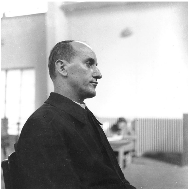
Nadbiskup Alojzije Stepinac na suđenju u montiranom procesu

kršćanstva i kako Hrvati trebaju biti Bogu zahvalni što su trinaest stoljeća vezani uz to središte. Rat je prekinuo normalno odvijanje tog projekta, ali je on obilježio u drugoj polovici 20. stoljeća glavnu duhovnu trasu razvoja i rasta Crkve u Hrvata. Možemo reći da je ključnu ulogu u tom razvoju i rastu imao Stepinčev učenik Franjo Kuharić.