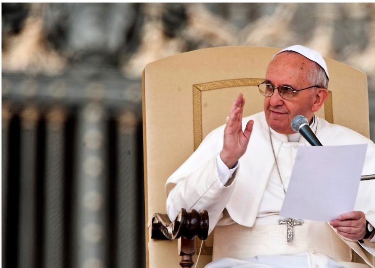
Nema sumnje da Papa ima sveti cilj pred sobom i da nema nešto protiv Hrvata

– Ovo što je papa Franjo učinio u slučaju Stepinčeve kanonizacije presedan je u Crkvi. To je jedna od tih inovacija pape Franje, koje sam malo prije spomenuo. Na kraju je zaključak Komisije da je proglašenje svetim samostalni čin svake Crkve. Kada znamo kakvim se kriterijima SPC služi za proglašenje sveti(telj)ima još teže nam je shvatiti Papin potez, iako ne sumnjam o dobre njegove namjere. Pratio sam rad te Komisije i o tome sam dosta opširno pisao u svojoj knjizi: „Srpsko pravoslavlje i svetosavlje u Hrvatskoj“ (2017.). Očito da papa Franjo gaji plemenita ekumenska stremljenja – ujedinjeno kršćanstvo. Posebno su ta njegova ekumenska stremljenja okrenuta prema pravoslavnom svijetu. Već odavna se govori o njegovoj želji da dođe u Moskvu – Treći Rim. Podsjetimo, kada je 1453. pao Carigrad, Drugi Rim, Moskva se proglasila Trećim Rimom. Treći Rim je danas važniji od Drugoga, ali je Papi s pravoslavne strane dano do znanja da put u Moskvu vodi preko Beograda. A Beograd kaže – preko Jasenovca, i to u skladu sa slikom kakva je ondje stvorena.