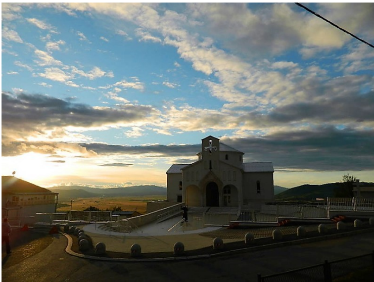
Crkva hrvatskih mučenika u Udbini

U petom, pretposljednem, nastavku feljtona o papi Piju XII. i Vatikanskom apostolskom arhivu umirovljeni biskup Gospičko-senjske biskupije mons. dr. sc. Mile Bogović (81), ujedno i crkveni povjesničar, s crkvene i povijesne strane osvjetlit će nam lik i djelo pape Eugenia Pacellija, odnosno Pija XII. Naravno, bit će riječi i o našem blaženiku kardinalu Alojziju Stepincu i procesu njegove kanonizacije, a kojega je upravo papa Pio XII. imenovao kardinalom. Biskup Bogović je, kao što znamo, najzaslužnija osoba za izgradnju Crkve hrvatskih mučenika u Udbini, u kojoj se, među ostalim, čuvaju i relikvije blaženog Alojzija Stepinca. Podsjetimo, biskup Bogović još je 2002. godine predstavio javnosti ideju o izgradnji Crkve hrvatskih mučenika u Udbini, nakon čega se projekt počeo polako razvijati, da bi već 2010. godine crkva bila dovršena. Zamišljena je kao skupno mjesto svih hrvatskih stradanja i muke hrvatskog naroda do ostvarenja svoje države i slobode. Crkva je svečano otvorena i blagoslovljena 11. rujna 2010. godine u nazočnosti više od 15 000 hodočasnika, a misno slavlje predvodio je vrhbosanski nadbiskup i metropolit kardinal Vinko Puljić. Riječ je o najvećoj crkvi na Udbini, ujedno i hrvatskom nacionalnom svetištu.