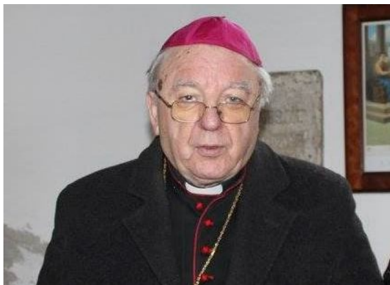
Danas se znanstvenim radom mnogo više bavim nego prije