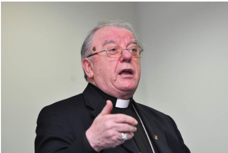
Pokažimo da smo „od stoljeće sedmog“ povijesno vezani uz Rim

Što se tiče pape Pija XII. ne treba ovim otvaranjem arhiva očekivati nešto bitno novo. Nakon što je objavljeno nekoliko knjiga kako je Pio XII. u vrijeme Drugog svjetskog rata šutke gledao zločine protiv čovječanstva, papa Pavao VI. je 1964. izdao dekret po kojem se dopušta objavljivanje spisa iz Vatikanskih arhiva za Drugi svjetski rat. Već 1965. započeo je jedan niz knjiga pod zajedničkim naslovom: „Sveta Stolica i Drugi svjetski rat“, iako još nije stiglo vrijeme za redovno otvaranje arhiva stručnjacima. Jednu od tih knjiga objavio je moj profesor sa Sveučilišta Gregoriana u Rimu. Znao nam je često govoriti o tim istraživanjima. Njegovu knjigu naslovljenu: „Pio XII. i Drugi svjetski rat prema Vatikanskim arhivima“ objavila je 2004. Kršćanska sadašnjost. Na stranicama od 176. do 179. govori se o prilikama u Hrvatskoj. Dakle, nekim crkvenim povjesničarima bilo je dostupno već odavno ono što je sada otvoreno i širem krugu istraživača. Razumljivo je da je svakoj ustanovi njezin arhiv uvijek dostupan. Jasno je također da će se u kilometarskoj građi naći i do sada nepoznatih dokumenata, ali do nekih većih obrata neće doći. Bit će uvijek onih koji će tražiti i u tim arhivima materijala kako bi optužili pred javnošću Pija XII. i Svetu Stolicu gradivom koje pronađu u njezinim arhivima. To se ne može spriječiti.