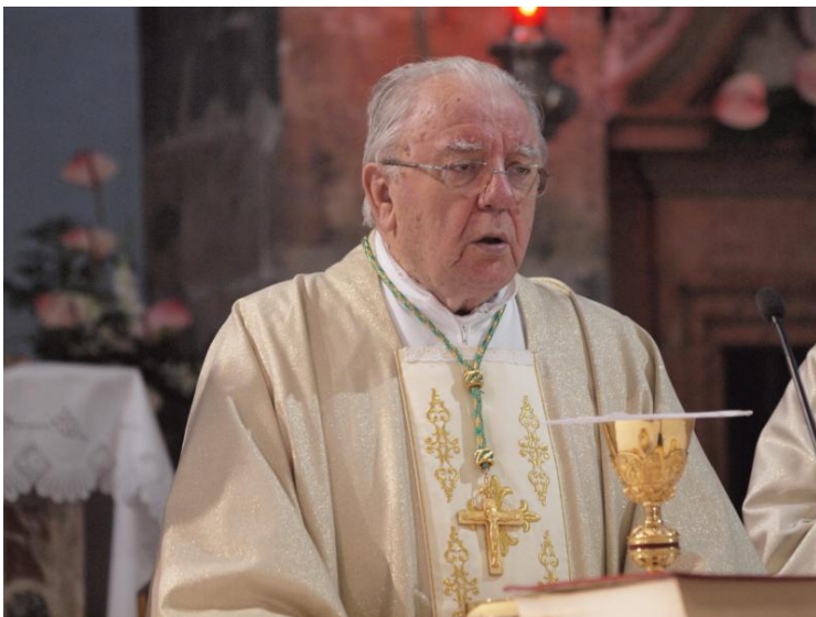
Svako otezanje kanonizacije Stepinca može samo koristiti