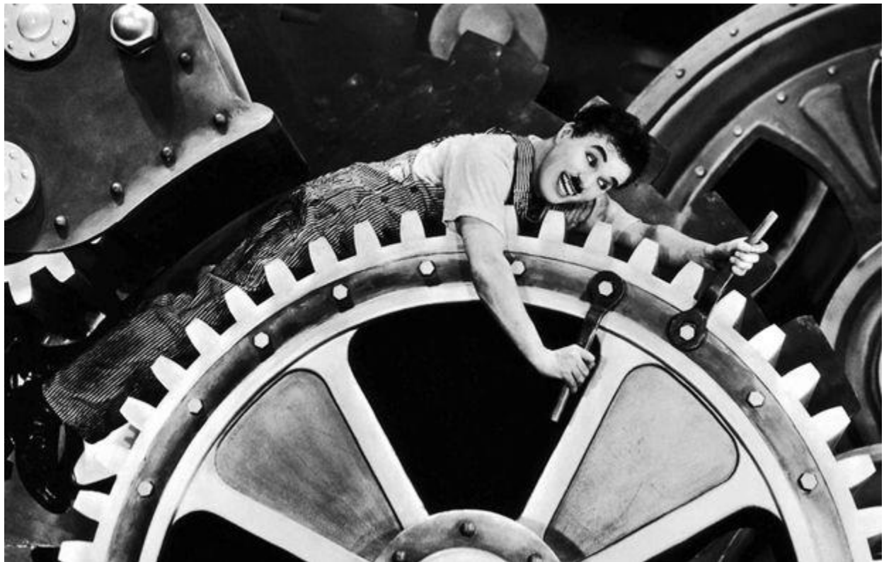
Charlie Chaplin, Moderna vremena, 1936.