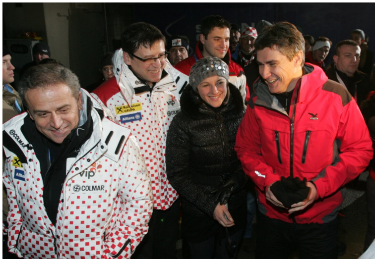
SNJEŽNA KRALJICA: Milan Bandić i Zoran Milanović u vrijeme dok su bili dva stupa SDP-a

izgubio od Ive Josipovića. Izlazak iz SDP-a je konačnu razbio svaku iluziju o nekim višim ciljevima i jasnoj političkoj doktrini. Politika je postala samo sredstvo da se ostane na vlasti i raspolaže javnim resursima koji su se dijelili po nepotističkoj ili nekoj drugoj interesnoj mreži. Čak je i Bandićev mentor Zdravko Tomac bio protiv te kandidature koja se pokazala potpuno promašenom. Očito je slušao savjete svojih podanika koji su mu govorili samo ono što je želio čuti.