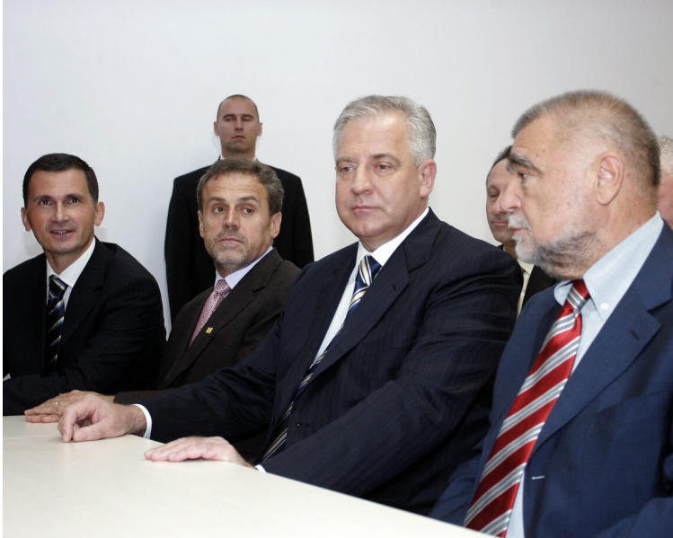
Milan Bandić je uvijek znao ugoditi onima koji su bili na moćnijoj političkoj funkciji

Bilo bi pogrešno reći da se Bandić u svojoj političkoj karijeri nije izživljavao na poraženima, ali u „u prosjeku” je vodio računa da gubitnici imaju častan uzmak. Imao je uvjet da mu se poklone, ali što je ta mala neugodnost prema sinekuri koja je garantirala dobre prihode bez prevelikog stresa i rada.