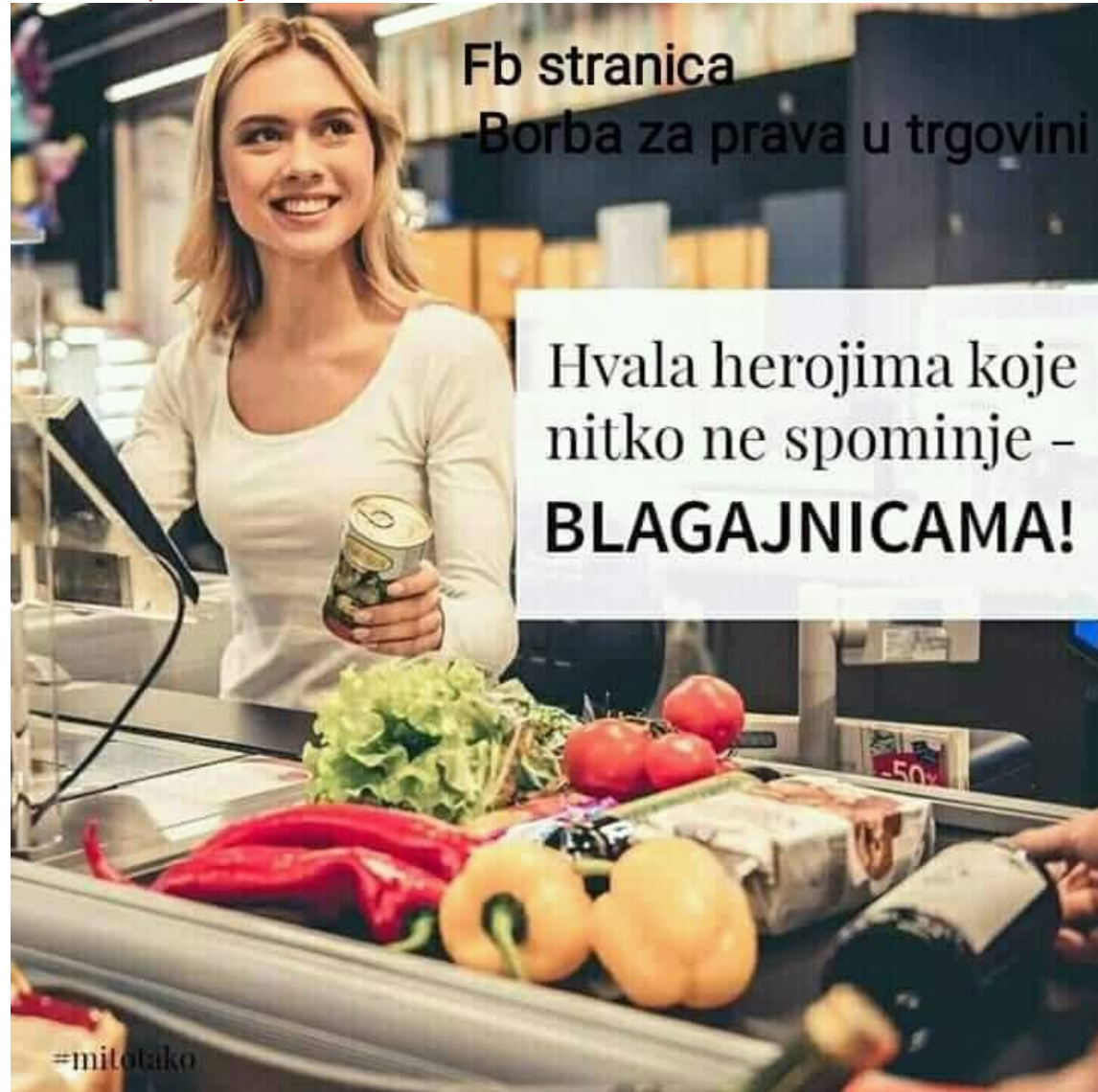
Foto: Borba za prava u trgovini

U Srbiji su poslodavci osigurali samo maske: “Sve preko toga nije bilo obezbeđeno. Takođe, ako se neko od radnika u trgovini razboleo ili mu je bilo potvrđeno prisustvo virusa Covid19, poslat je na kućno lečenje, ali uz važeću odredbu trenutnog zakona o radu, koji predviđa da se radnicima na bolovanju isplaćuje 65 posto od zarade, što je potpuni skandal bio za vreme pandemije i sveopšteg vanrednog stanja. Takođe, radnici u trgovini su bili mnogo više izloženi virusu te su morali da dobiju i veću zaštitu ili makar stimulaciju zbog rizika kom su bili izloženi”, objašnjavaju aktivisti te dodaju da su unatoč navedenim teškoćama radni uvjeti radnika i radnica bili nešto bolji za vrijeme karantene, baš zato što nisu radili za vrijeme policijskog časa i nedjeljom.