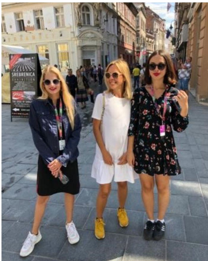
(Uma na Sarajevo film festivalu)

- Ja sebe ne želim nazivati posebnom i drugačijom, iskreno ne vidim nikakvu preveliku razliku između sebe i ostalih svojih vršnjaka. Mislim samo da sam ja imala više prilika u djetinjstvu da učim nego oni. Sva su djeca znatizeljna i motivirana samo što nemaju tako poticajnu okolinu kao što sam imala ja – od roditelja, učiteljice pa do svih odraslih osoba kojima sam vjerovala i koji su me jako poticali na učenje i istraživanje i to – kaže. Nije preskakala razrede, ali je u školu krenula godinu dana ranije nego je trebala.