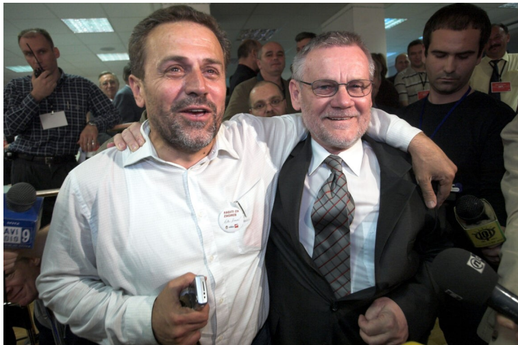
Milan Bandić i Ivica Račan dočekuju rezultate lokalnih izbora 2005. godine na kojima je SDP ponovno pobijedio u Zagrebu

Jedna je linija "društvenog djelovanja" bila klasična veza sa „zemljacima" koji su krenuli za boljim životom u mitski Zagreb, ali ne treba zanemariti ni partijsku vezu koju je imao sa snažnom „čelijom" u svom rodnom kraju. Na Bandićevu karijeru veliki utjecaj je imao poznati poduzetnik iz njegovog sela Anđelko Leko kod kojeg je neko vrijeme stanovao kada je došao u Zagreb.