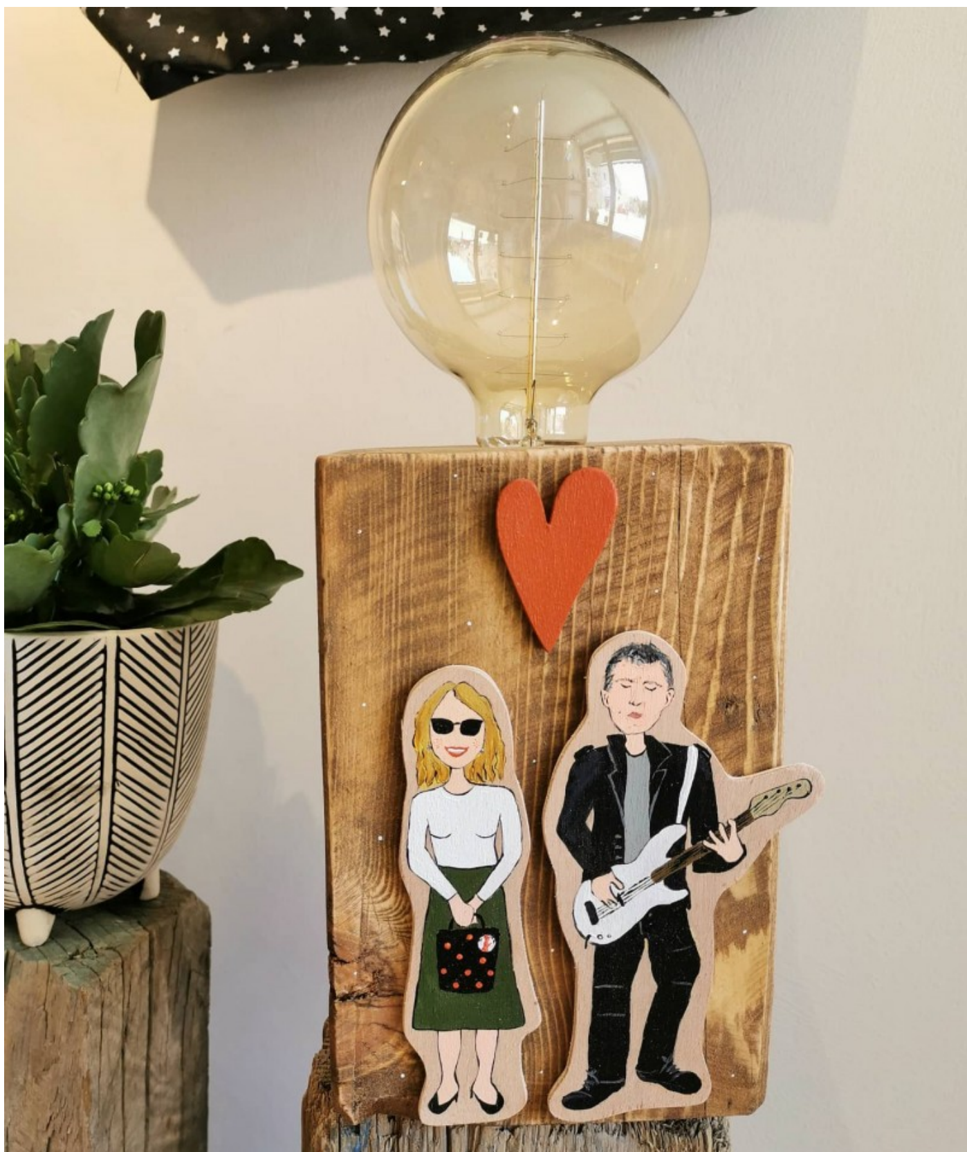
Ručno izrađena lampa koje personalizira i oslikava prema željama