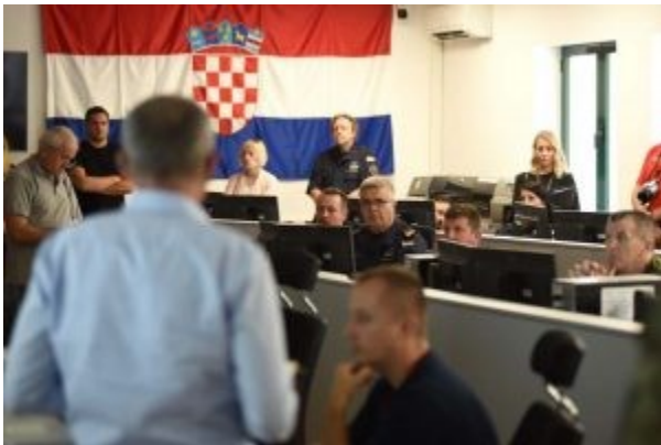
Damir Krstičević u obilasku Operativnog vatrogasnog zapovjedništva

SOPHIA”. Stavka “UN misije (A545065)” s padom od 35,11 posto tijekom 2019. (od 15,034 milijuna HRK krajem 2018. na 9,756 milijuna na kraju 2019. godine) obuhvatila je 3 misije (UNMOGIP, UNIFIL i MINURSO), od kojih je posebno značajno djelovanje u Libanonu, započeto u svibnju 2018. godine i dovršeno u svibnju 2019. godine . Ponešto je manje tu smanjivana stavka “NATO operacije (A545066)”, koja je tijekom 2019. pala za 16,43 posto (od 146,35 milijuna krajem 2018. na 122,3 milijuna na kraju 2019. godine). RH je tu djelovala u ukupno 6 aktivnosti – (1) u NATO misiji “Resolute Support” u Afganistanu, (2) operaciji KFOR na Kosovu, (3) u misiji (NATO Mission Iraq – NMI) u Iraku, (4) u operaciji “SEA GUARDIAN” na Mediteranu , (5) u aktivnosti ojačane Prednje prisutnosti (eFP) u Poljskoj, te (6) u operaciji koalicijskih snaga “INHERENT RESOLVE” u Kuvajtu. No, o svemu tome se čulo jako malo, a čak ni žrtve u Afganistanu nisu na kraju bile povodom za ozbiljnije javno izvještavanje iz takvih aktivnosti .