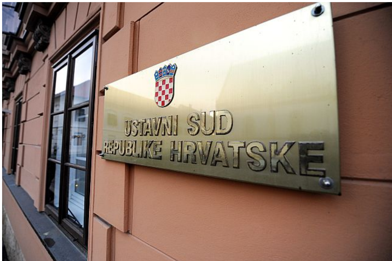
Ustavni suci smatraju da rješenje mnogobrojnih preostalih moralnih i pravnih konflikta oko ovog pitanja ovisi o političkom dogovoru

Činjenica da tada nitko nije bio zainteresiran za tu zakonsku novost i da uopće nije bilo javne rasprave, nije samo dokaz inercije mnogih skupina koje su za tu temu mogle biti zainteresirane (ženske i liječničke udruge), nego i simptom potpune isključenosti javnosti iz procesa odlučivanja o bilo čemu u zdravstvu.