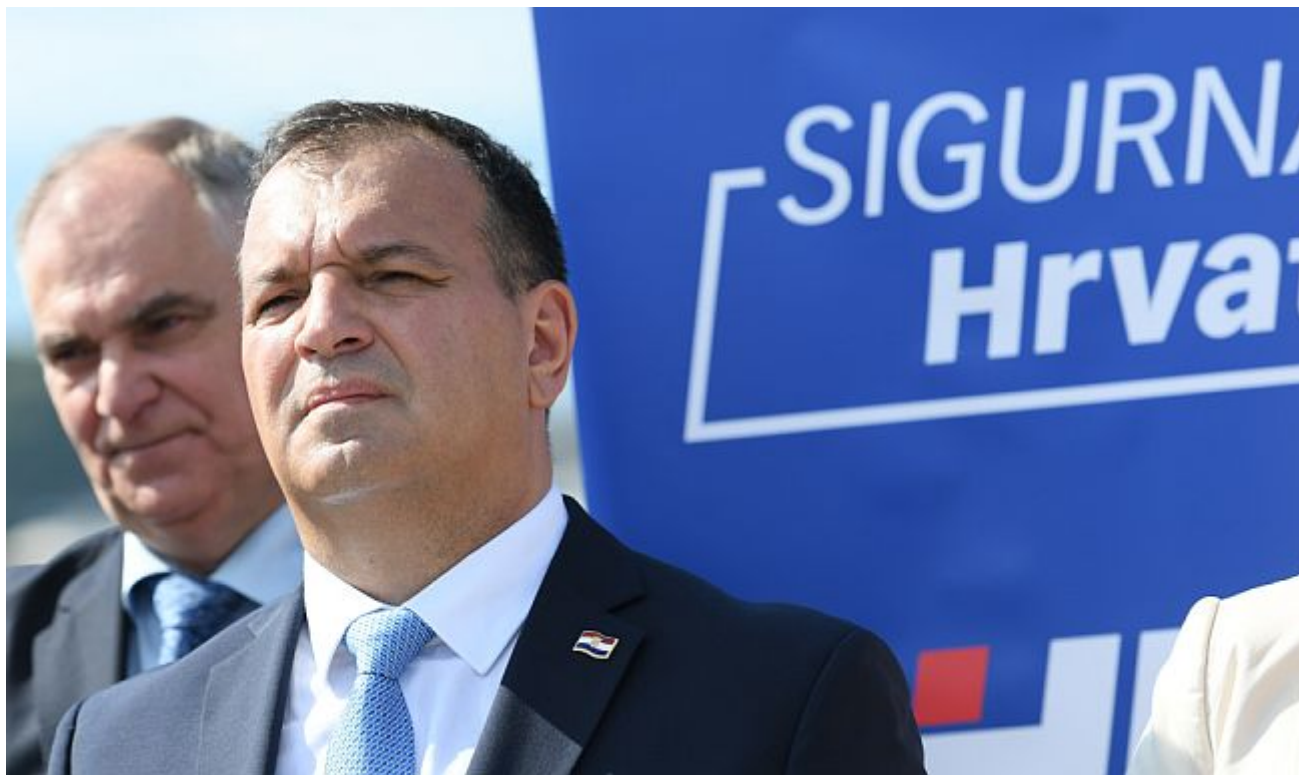
Nakon postavljanja Vilija Beroša i postizborne stabilizacije HDZ-a kao desnog centra, Hrvatsku vjerojatno samo epidemija koronavirusa dijeli od prvog prijedloga novog Zakona o abortusu

Svakako, tek kada tzv. Zakon o abortusu dođe na red, počinje proces razumijevanja svih etičkih i pravnih problema koje takva legislativa prati, kao i uzroka kaotičnog stanja za koje su odgovorne razne javne politike, osobito politika zdravstva. S obzirom da je HDZ-ov politički uzor njemačka Kršćansko-demokratska unija (CDU), može se pretpostaviti da će prijedlog zakona sadržavati: a) obvezno savjetovanje prije konačne odluke o abortusu i b) dupliranje prava na priziv savjesti u medicini (iako je već upisano u Zakon o liječništvu i liječničke kodekse) bez posebnih ograničenja.