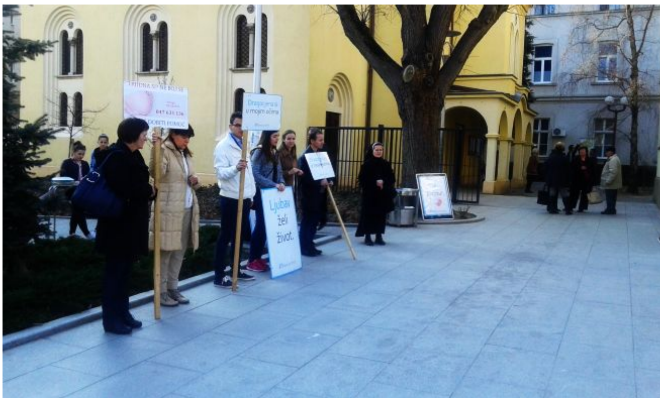
"Molitelji" ispred Vinogradske bolnice

Ustavni suci smatraju da rješenje mnogobrojnih preostalih moralnih i pravnih konflikta oko ovog pitanja ovisi o političkom dogovoru , pa ga sukladno tome prosljeđuju zakonodavcu, koji će ga donijeti u skladu s tradicijom, tumačenjem normi i javnog morala. Tako će Hrvatski sabor u konačnici odlučiti do kojeg razdoblja je primjereno dopustiti pobačaj na zahtjev, treba li žena proći savjetovanje, tko plaća zahvat i pitanje priziva savjesti liječnika. Sud se izriekom očitovao da pobačaj bez medicinske indikacije mora biti iznimka i da novi Zakon mora biti donesen u roku od dvije godine.