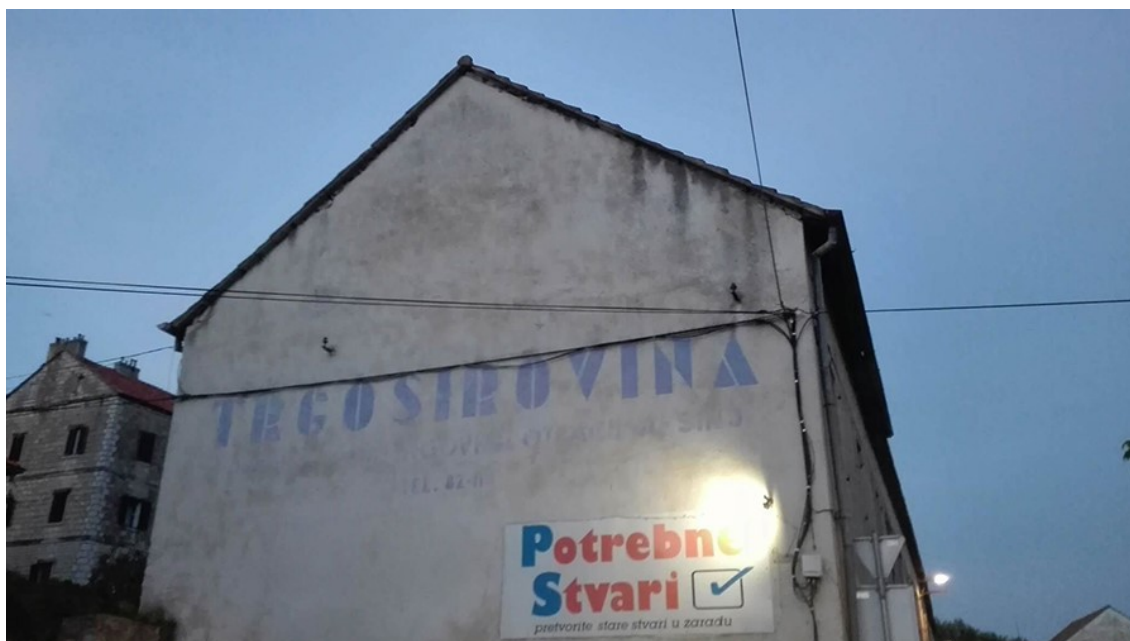
Upravna zgrada bivše tvornice Trgosirovina, Sinj, kolovoz 2020.

Među aktualnim problemima treba spomenuti i nepostojanje filtera otpadnih voda, pa tako kanalom kroz centar grada teče kanalizacija čiji vas „miris“ prati u obilasku kao i prizori uništene tvorničke infrastrukture. Možda je s vremenskim odmakom teško shvatiti koliko je pedesetih godina prošlog stoljeća industrijalizacija unaprijedila život Sinjanki i Sinjana, ali je zato bolno očigledno koliko su ga deindustrijalizacija i privatizacija uništile.