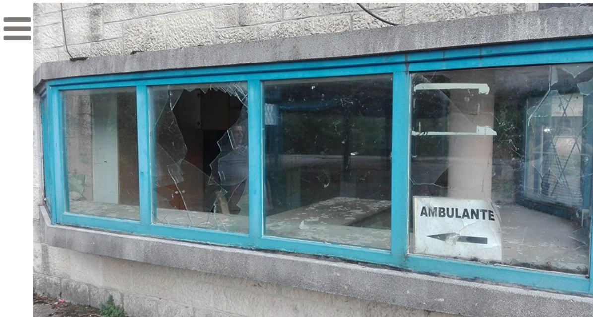
Znak na dijelu bivše tvornice Dalmatinka koji pokazuje prema ambulanti, Sinj, kolovoz 2020.

Među selima koja bilježe najveći pad stanovništva u splitsko-dalmatinskoj županiji su i sela sinjske krajine poput Vrlike i Hrvaca. Uz usporedno propadanje prometne infrastrukture uspostavljene u socijalizmu, zdravstvena skrb sve je nedostupnija, naročito preostalim žiteljima udaljenijih sela.