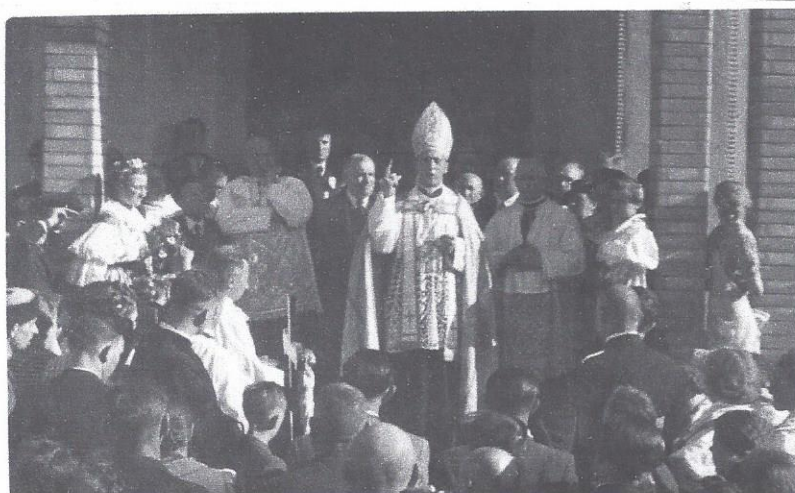
Posvjećeni "Samoživio domu Brodačova" čestitkom p. m. Dr. S. Stepinaca Zagrebački nadbiskup Alojzije Stepinac govori na svečanosti blagoslova Češkog doma u Daruvaru 1939.