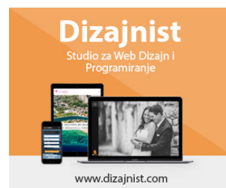
( https://dizajnist.com ).