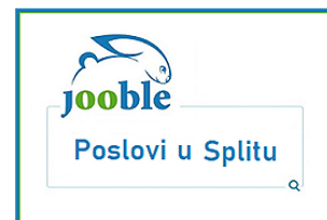
( https://hr.jooble.org/posao/Split?main ).