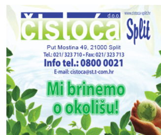
( http://www.cistoca-split.hr/eracun ).