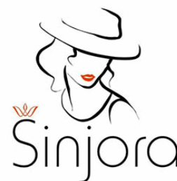
( https://web.facebook.com/%C5%A11801985340097784/ ).