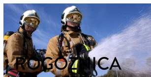
POGOZINICA Gorilo u mjestu Kotelja