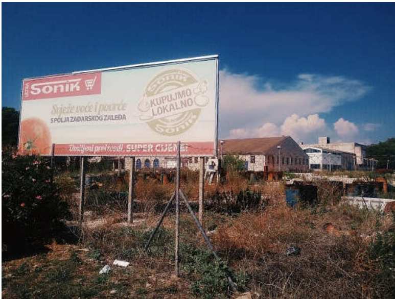
Reklama kod tvorničkog kruga Adrije

Kad je promatram ne mogu da se ne sjetim kako je Gene Kelly opisao razliku u plesu između njega i Freda Astairea. "Fred Astaire predstavlja aristokraciju kad pleše, a ja predstavljam proletarijat", tvrdio je Kelly. Astaire - visok, tanak i lebdeći, Kelly - mišićav, snažan, prizemljen. Njihova najveća plesачka razlika proizlazi iz posve drugačijeg odnosa prema tlu pod nogama. Jedan (Astaire) fluidno plivi po površini i bez problema leprša iznad nje, baš kao aristokracija i elita, dok drugi (Kelly) uvijek ima jasno težište, snažno uzemljenje, kao ono koje radnici i radnice imaju (ili su imali) u polju, tvornici, radničkom naselju.