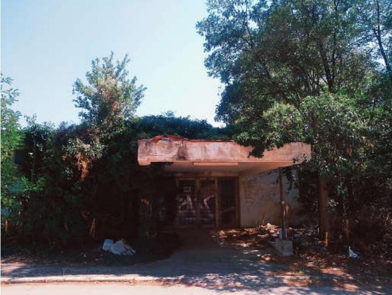
Prostor oko tvorničkog kruga Adrije danas

"Pametan čovik. I zgodan je bia", kratko komentira Ika. Rastajemo se pred apartmanskom trokatnicom, pitam je prije odlaska ima li nešto posebno što želi da napišem. "Napiši da sam voljela radit sa ženama. Znale smo se svađat, ali smo jedna drugoj uvijek pomagale. Čuvale dicu, posuđivale novce. Uvijek smo se zajebavale, i kad je bilo najteže. Milijun puta su me spasile i ništa nazad nisu tražile".