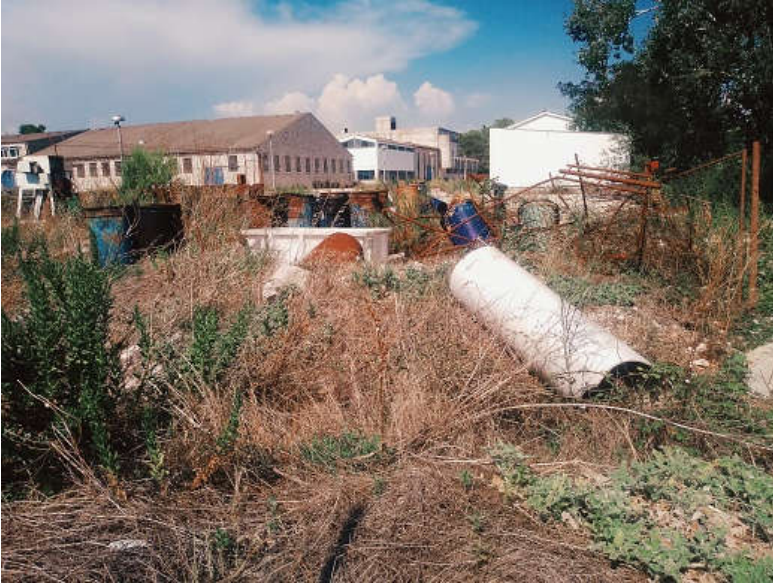
Pogled na dio tvorničkog kruga Adrije danas

zapravo dobro zaraditi), na njemu istovremeno netko i dalje zaraduje - krađama strojeva i materijala iz tvorničkog kruga.