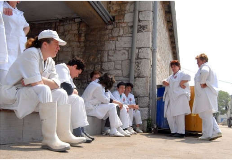
Štrajk solidarnosti u Adriji 2010. godine