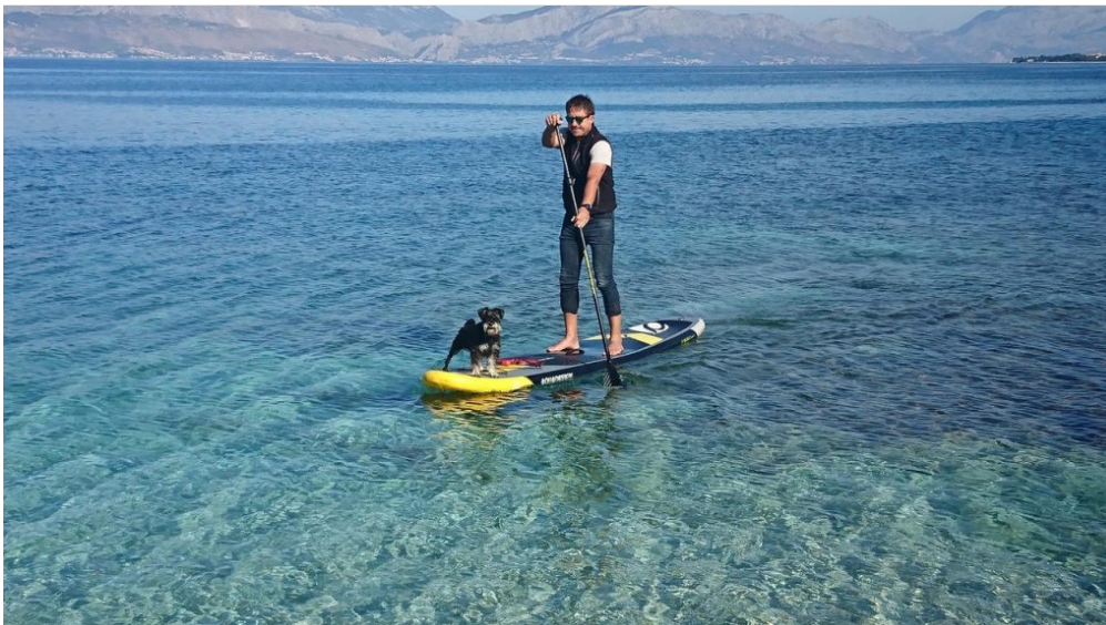
SUP Šteka i pas Bura