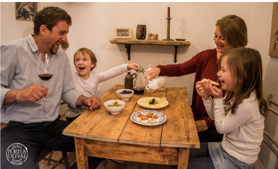
Ljubetići u kušaonici ulja i ideja

– Moglo bi se reći da bez japna nije bilo moguće zamisliti da se na Braču živi, a meštiri od japnenica zapravo bili pravi velemaštiri koji su svojim rukama slagali kamen do kamena. Daljna je atrakcija uvale Vičja luka – čisti horor i tu usred bijela dana. Vičja luka zapravo znači Vješticija luka, što će reći da su uz to mjesto vezana brojna praznovjerja i legendi. Zadnju štorija je ona o Bobovišću kao rodnom mjestu Vladimira Nazora. Kad kajakaši konačno tamo izvuku svoje brodice na žalost i zalegnu ispod bora, tek tada će moći shvatiti one čudesne Nazorove stihove: 'I cvrči, cvrči cvrčak na čvoru crne smrče...' – kaže dodajući kako je tematska pustolovna ruta kajacima jedinstvena po tome što se može prići i kopnom. A mogu to zato, jer su naraštaji svojim nogama izdubili staze i puteve, koje su suvremenici pripremili potrebama novog doba.