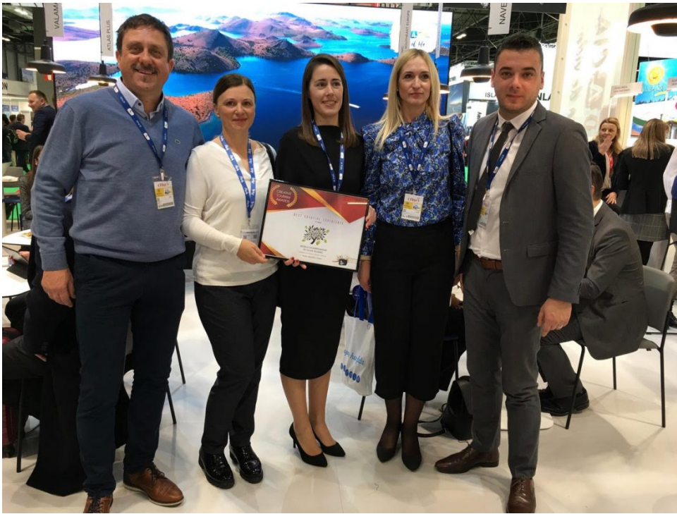
Madrid, naj event 2020.