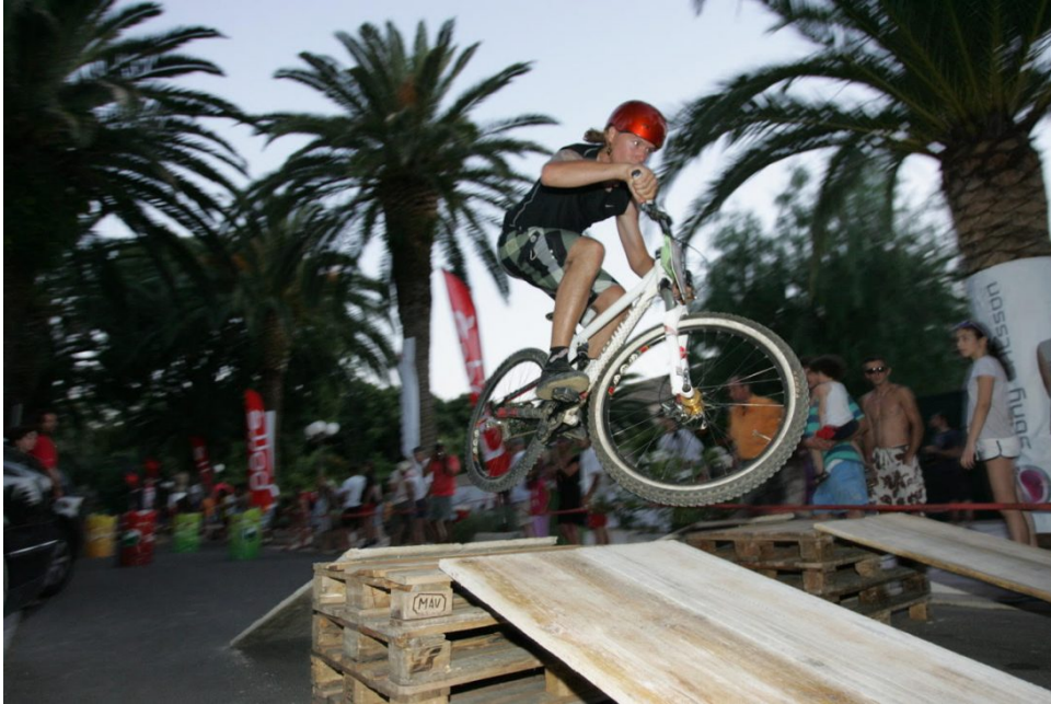
Sivanski ekstremizam

Obdaren karakterom koji je sam po sebi pravi pršteći event on nije stao na prvoj od svojih ljubavi – ekstremnim sportovima. Uz Vanka regule, vođen jednako tako snažnom emocijom smislio je Svjetsko prvenstvo u branju maslina, događaj koji je krajem siječnja u Madridu dobio prestižnu nagradu najboljeg svjetskog događaja. Ove godine stoji iza druge godine uspješnog ambijentalnog boutique festivala More Jazz, a dok smo razgovarali zdušno je, uz uobičajne poslove u svojoj agenciji radio na pripremama prve uzmorsko-morske staze sa 10 lokaliteta koja će morem i kopnom povezati zapadnu stranu Brača. Od svega ovoga, međutim, Šteka je imao želju najviše razgovarati vanka od mene propisane regule, pazite sad – o poljoprivredi.