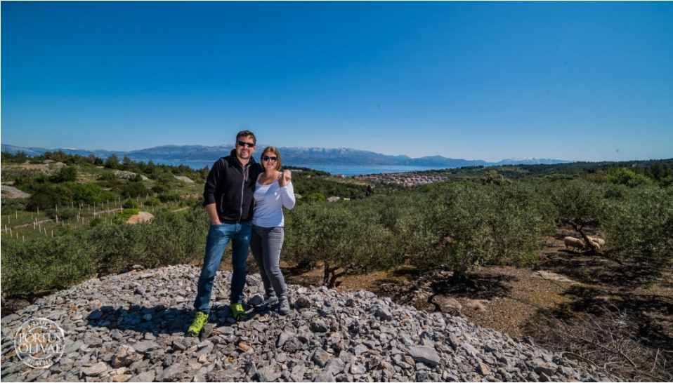
Iv i Eti u masliniku Podol

– Rutu tematiku' smislio sam na temelju dugogodišnjeg iskustva s kajakašima. Priča započinje u Sutivanu, a prva atrakcija je antički brodolom u Likvi. Riječ je o pješčanoj uvali nedaleko od Sutivana, u kojoj se nedaleko od obale, na 30 metara dubine, nalazi podmorski arheološki lokalitet. Nekad davno tu je potonuo rimski brod koji je prevozio kamene sarkofage i velike blokove kamena iz nekog od ondašnjih kamenoloma na Braču, najvjerojatnije prema Saloni.' – kaže Šteka, ističući kako će moderni galijoti kajakaši cijelo vrijeme veslati u zaštićenom pojasu Natura 2000. To znači da im maska za ronjenje neće biti od koristi samo dok se u Likvi budu igrali Indiana Jonesa nego će im i poslužiti za istraživanje hridi i grebena okruženih zaštićenim nepreglednim livadama posidonije. Slijedeća tematska postaja vezana je za uz bračku etno-baštinu. Riječ je o staroj japnenici na plaži Deralo, a prilog za proučavanje fenomena izgubljenog sjećanja je i to da mlade generacije Dalmatinaca ne znaju što je to japno iliti vapno i japnenica ili vapnenica.