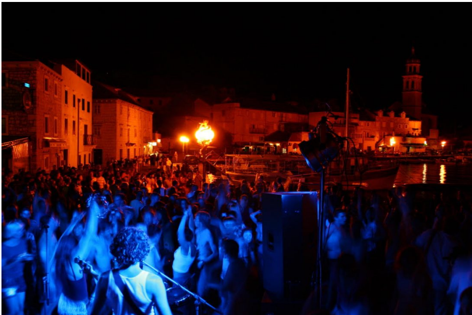
Šušur Vanka regule

( https://croatia.hr/hr-HR/doziviljaji/nautika?utm_campaign=HR_DN_brand-2_nautical_2020_morski.hr&utm_medium=cpc&HR_Morski_N_400x600 )