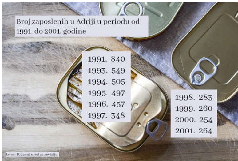
Broj zaposlenih u Adriji u periodu od 1991. do 2001. godine (Vizual: Ivana Perić)