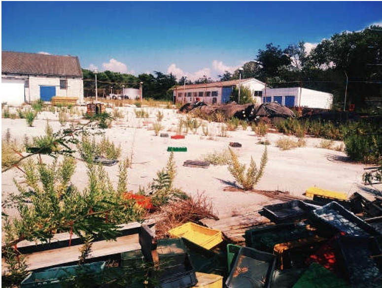
Jedno od dvorišta unutar tvorničkog kruga Adrije danas

"Radnička potraživanja su bila 12 milijuna kuna, a umanjena su za dva milijuna kuna, jer je državna agencija radnicama isplatila iznos od tri minimalne plaće po radniku. Nema nažalost nade da će radnička potraživanja biti do kraja ispunjena, jer je sva imovina Adrije pod hipotekom, čime će se nakon prodaje namiriti različiti vjerovnici, banke. Pod hipotekom nisu jedino pokretne, a pokretne su uglavnom zastarjeli i neodržavani strojevi koje nitko ne želi kupiti", zaključuje Bijelić.