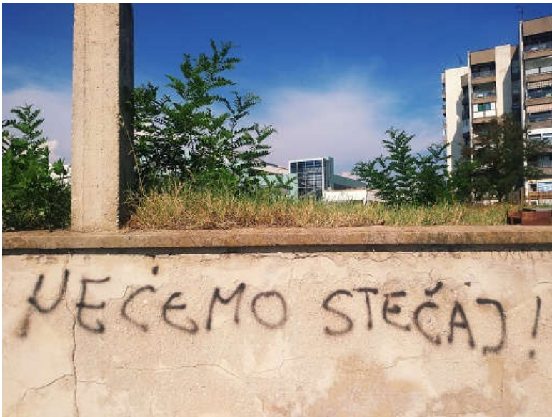
'Nećemo stečaj' na zadarskim ulicama

Ovo je četvrti u seriji od šest tekstova 'Adrio bella' , o zadarskoj industriji i prošlosti i sadašnjosti Tvornice za preradu i konzerviranje ribe Adria. Prvi tekst, pod nazivom 'Iza Bagatovog nebodera, kod bivšeg SAS-a' , koji nudi pregled razvoja zadarske industrije i Zadra kao grada od Drugog svjetskog rata do danas, možete pročitati ovdje . Drugi tekst, pod nazivom 'Nije kriva radnica, što je riba smrdljiva' , o specifičnostima riboprerađivačke industrije i ženskog rada u tvornicama ribe, pročitajte ovdje . Treći tekst, pod nazivom 'Bolji od Popaja, jači nego Chuck Norris' , o nastanku i popularnosti maskote Adrijinih Eva proizvoda – morža Šime, te prodaji brenda Eva Podravci, pročitajte ovdje .