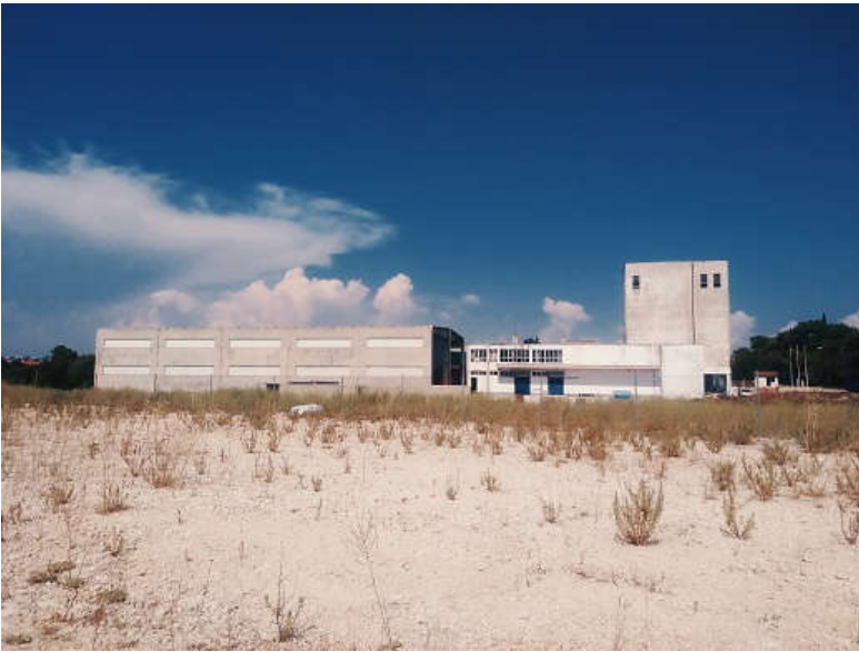
Pogled na dio tvorničkog kruga Adrie danas

Podravka je dio svog ribljeg asortimana Eva proizvoda nastavila proizvoditi u stankovačkoj Ostrei, a u Ostrei je rad nastavio i dio nekadašnjih Adrijinih radnica. Neven Badurina kasnije je optužen da je u Ostrei u razdoblju od siječnja 2017. godine do rujna 2018. godine "s ciljem pribavljanja nepripadajuće materijalne koristi u više navrata bez ikakve valjanje osnove sa žiro računa društva podizao i zadržavao za sebe novac društva u ukupnom iznosu od preko 5.700.000,00 kuna, a kako bi knjigovodstveno pravdao isplate tog iznosa fiktivno je prikazivao da je novac položen u blagajnu društva". Zbog sumnji u niz malverzacija s Ostreom i Luna hotelom na Pagu proveo je nekoliko mjeseci u istražnom zatvoru.