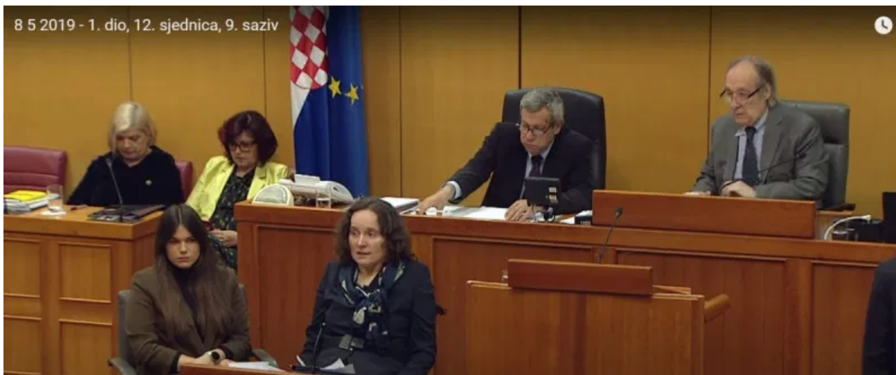
Anka Slonjšak u Saboru

Obrazovanje u ustanovama socijalne skrbi ne smatra se segregacijom, a obrazovanje općenito još uvijek nije dovoljno prilagođeno, pristupačno i prihvatljivo za svu djecu, učenike i studente. Već niz godina upozoravamo da neosiguravanje primjerene stručne podrške djeci s teškoćama u razvoju u smislu ranog poticanja razvoja predstavlja nepoštivanje odredbi Konvencije o pravima osoba s invaliditetom ali predstavlja i diskriminaciju djece s osnova zdravstvenog stanja. Uz i dalje prisutan problem dijagnostike i stručne podrške djeci s teškoćama iz autističnog spektra, zabrinjavaju pritužbe zbog slabije dostupnosti različitih usluga za podršku u obitelji ili smanjivanja intenziteta rehabilitacijskih usluga za djecu i mlade s različitim teškoćama u razvoju. Pravobraniteljica niz godina zaprima pritužbe roditelja djece s teškoćama u razvoju iz različitih područja Republike Hrvatske zbog nedostatka pružatelja rehabilitacijskih usluga i nedostatka kapaciteta postojećih pružatelja usluga, smanjivanja intenziteta rehabilitacijskih postupaka i sl.