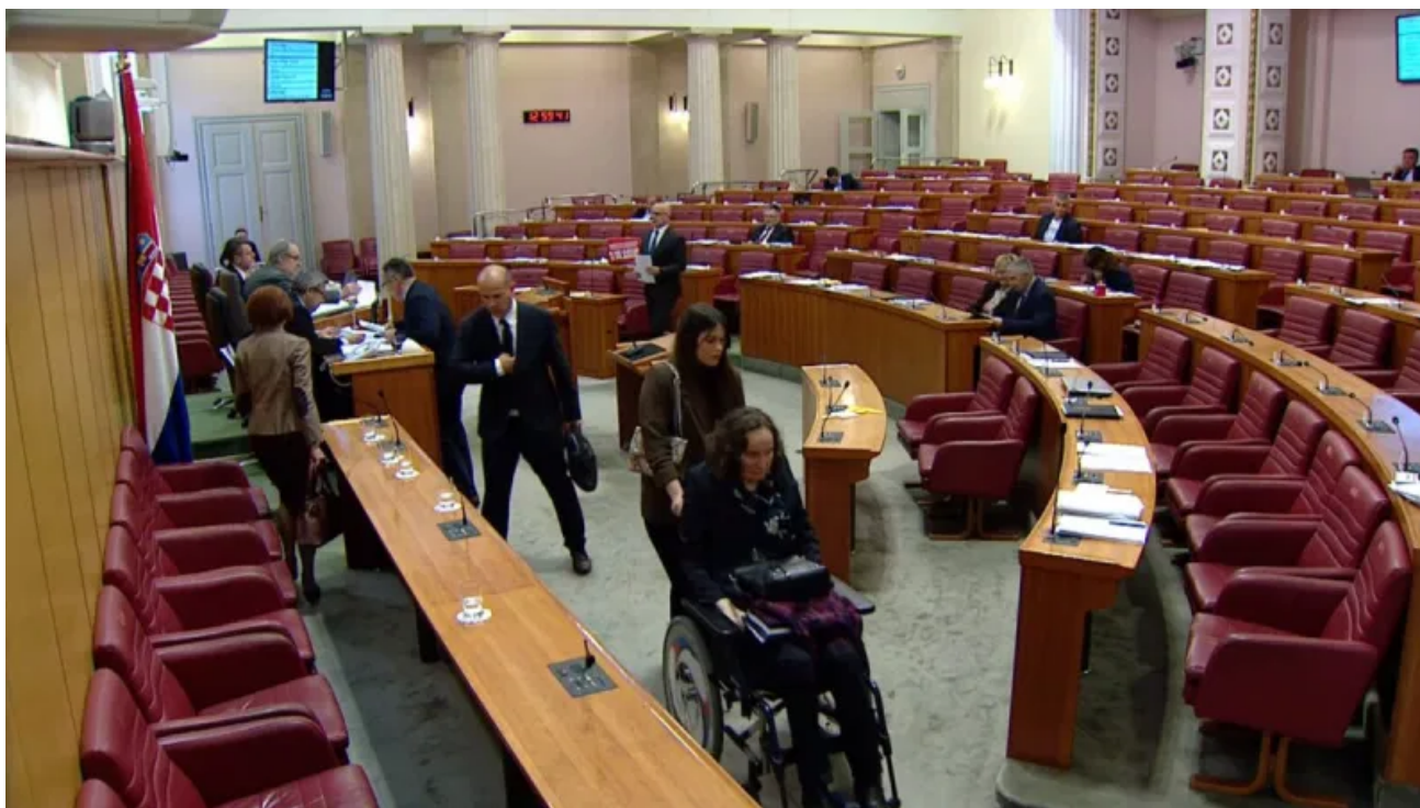
Anka Slonjšak odlazi iz Hrvatskog sabora

-Kada govorimo o mirovinskom osiguranju, najviše pritužbi odnosilo se na dugotrajnost postupka ostvarivanja mirovina . Prema podacima HZMO-a evidentirano je zbog opće nesposobnosti za rad, odnosno potpunog gubitka radne sposobnosti 43.123 osoba koji su primali prosječnu mirovinu u iznosu od 2.334,65 kn . Najveći broj OSI u RH, odnosno 64.925 korisnika koristi invalidsku mirovinu zbog profesionalne nesposobnosti za rad , odnosno djelomičnog gubitka radne sposobnosti u prosječnom iznosu od 1.949,55 kn . Zabrinjava podatak da je od ukupno 64.925 osoba koje su u invalidskoj mirovini zbog profesionalne nesposobnosti za rad, tek njih 5.078 bilo u radnom odnosu. Organizacijama civilnog društva koje se bave pitanjima OSI, kao i njihovim predstavnicima, slabi zagovaračka uloga. Osobe s invaliditetom participiraju u pripremi zakonodavnih rješenja kroz Povjerenstvo Vlade Republike Hrvatske za osobe s invaliditetom, radne skupine i neformalne sastanke, međutim mišljenja smo da je često njihova uloga samo formalne naravi – napominje Anka Slonjšak .