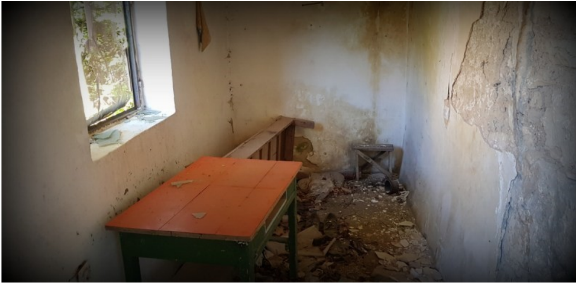
Ostaci nekadašnjeg života...

U Hrvatskoj istrage nije bilo, ali je zločin u Gruborima bio uvršten u optužnicu protiv generala Ante Gotovine, Ivana Čermaka i Mladena Markača.