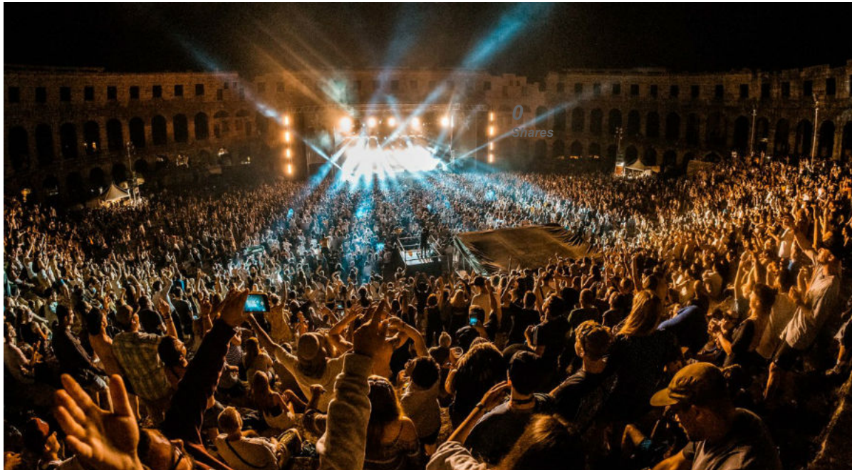
Outlook festival

Hrvatska festivalska produkcija počela se zahuktavati u ljeto 2007. najviše oko zagrebačkog INmusic a i zadarskog The Gardena.