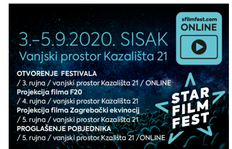
( https://sfilmfest.com/ )

NOVO PORINUĆE U RADEŽU Pri kraju je prva faza gradnje 52 metra dugog luksuznog broda MV Anthea ( https://morski.hr/2020/08/23/novo-porinuce-u-radezu-pri-kraju-je-prva-faza-gradnje-52-metra-dugog-luksuznog-broda-mv-anthea/ )