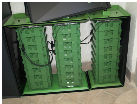
( https://morski.hr/wp-content/uploads/2020/07/Struja-pogon-akumulaton-baterije.jpg )

Prema njegovim riječima nakon Domovinskog rata na Krku su se artikulirale dvije struje. Jedni su htjeli resorte s po 5 zvjezdica, kockarnice, klijentelu lažnog sjaja... Većina otočana ipak je odabrala sasvim drugačiju priču koja bi se mogla nazvati kolektivnom odlukom da je za budućnost i bolji život i opće dobro pametnije poštivati stoljećima razrađena načela održivog razvoja. Put je pokazala i konferencija Ujedinjenih naroda o okolišu i razvitku u Rio de Janeiro 1992., temeljem koje je proveden niz projekata te je općina još 1999. godine dobila je diplomu Vijeća Europe kao najbolja komuna na Mediteranu za svoju viziju održivog razvoja.