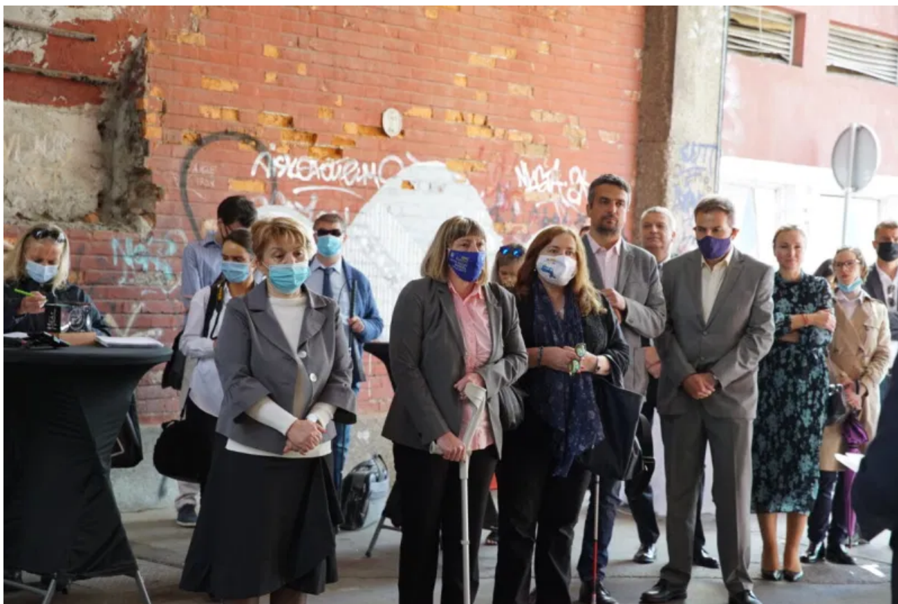
S otvaranja novog pogona